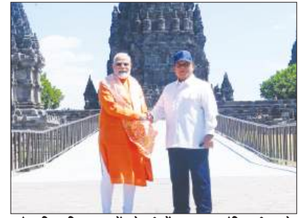
सांस्कृतिक विरासत हमें जोड़ती है, प्रब्रानन मंदिर परिसर के संरक्षण के लिए इंडोनेशिया का आभार : मोदी पृष्ठ 7