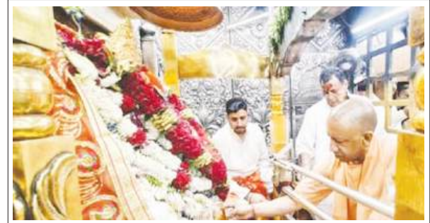
मुख्यमंत्री आदित्यनाथ ने की मां विध्ववासिनी मंदिर में पूजा-अर्चना

चित्रकूट : उत्तर प्रदेश के मुख्यमंत्री योगी आदित्यनाथ ने बुधवार को कांग्रेस और समाजवादी पार्टी (सपा) पर राम मंदिर चढ़ावा चोरी मामले का राजनीतिकरण करके अयोध्या और भगवान राम की विरासत को बदनाम करने का आरोप लगाया। उन्होंने कहा कि राज्य सरकार ने श्री राम जन्मभूमि तीर्थ क्षेत्र ट्रस्ट की सिफारिश पर विशेष जांच दल (एसआईटी) से जांच कराने का आदेश दिया। चित्रकूट में 950 करोड़ रुपये से अधिक की परियोजनाओं के लोकार्पण के बाद एक सभा को संबोधित करते हुए आदित्यनाथ ने कहा कि मामला सामने आने के बाद विपक्षी दल अनाक सक्रिय हो गए हैं क्योंकि उन्हें अयोध्या को निशाना बनाने के लिए एक मुद्दा मिल गया है। उन्होंने कहा, आपने हाल की खबरें सुनी होंगी। कांग्रेस और समाजवादी पार्टी अचानक सक्रिय हो गईं। ये वे पार्टियां हैं जिन्होंने ऐतिहासिक रूप से अयोध्या की आलोचना की है, और उन्हें फायदा उठाने के लिए एक मुद्दा मिल गया है। मुख्यमंत्री ने कहा कि ट्रस्ट ने स्वयं सरकार को सूचित किया कि उसे दान की गिनती के दौरान कथित चोरी के बारे में जानकारी मिली है और एक उच्च स्तरीय एसआईटी का गठन किया जाना चाहिए। उन्होंने कहा, हमने ट्रस्ट की सिफारिश को स्वीकार करके एक उच्च स्तरीय एसआईटी गठित की। जांच के दौरान चोरी में सीधे तौर पर शामिल पाए गए छह लोगों के खिलाफ सबूत मिले, जबकि दो अन्य व्यक्ति साक्ष्य का हिस्सा थे। एसआईटी की सिफारिशों के आधार पर ट्रस्ट ने एक प्राथमिकी दर्ज करके कार्रवाई की।