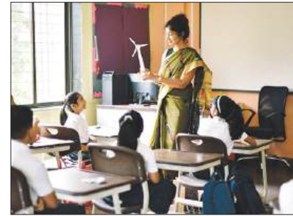
स्कूल शिक्षा रिपोर्ट कार्ड: राज्यों-केंद्रशासित प्रदेशों में चंडीगढ़ सबसे आगे पृष्ठ 7

कोलकाता, आषाढ़ कृष्णपक्ष अष्टमी, वि.स. 2083, पृष्ठ 8, मूल्य 3.00 रुपये सुविचार : बुरा दिन आने पर इतना हौसला रखना कि दिन बुरा था जिंदगी नहीं।