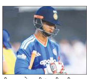
पीछा करने उतरी भारतीय टीम मात्र 11.4 ओवर में 76 रन पर सिमट गई। आर्चर ने तीन ओवर में 29 रन देकर तीन विकेट, जबकि जोश टंग

नॉटिंगहम : जोफ्रा आर्चर और जोश टंग की घातक गेंदबाजी के सामने भारतीय बल्लेबाजी पूरी तरह बिखर गई और तीसरे टी20 मुकाबले में इंग्लैंड ने भारत को 125 रन से करारी शिकस्त दी। रनों के अंतर से यह भारत की टी20 अंतरराष्ट्रीय क्रिकेट में सबसे बड़ी हार है। पांच मैचों की श्रृंखला में इंग्लैंड ने 2-0 की बढ़त बना ली है, जबकि पहला मैच बारिश के कारण रद्द हो गया था। इंग्लैंड के 202 रन के लक्ष्य का