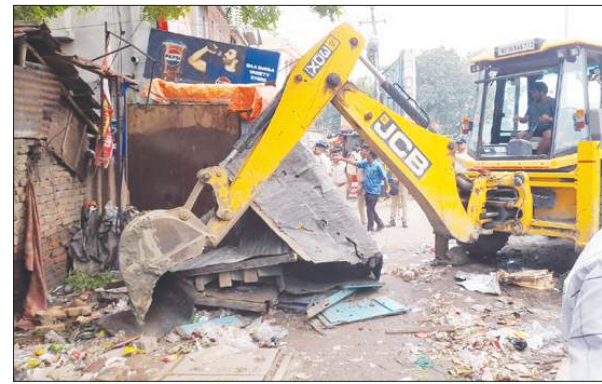
संरचनाओं को हटाया गया। रेलवे प्रशासन ने बताया कि अतिक्रमण से मुक्त कराई गई भूमि का उपयोग भविष्य की रेलवे परियोजनाओं और सुरक्षा संबंधी आवश्यकताओं के लिए किया जाएगा। अभियान के दौरान कुछ समय के लिए इलाके में

हावड़ा, समाज्ञा : शालिमार रेलवे स्टेशन के पास नेपाली पाड़ा इलाके में सोमवार सुबह रेलवे प्रशासन ने अवैध अतिक्रमण के खिलाफ बड़ा अभियान चलाया। इस दौरान बुलडोजर की मदद से रेलवे भूमि पर बने कई अवैध निर्माणों को ध्वस्त किया गया। जानकारी के अनुसार, लंबे समय से रेलवे की जमीन पर अवैध रूप से कब्जा कर मकान और अन्य ढांचे बनाए गए थे। कई बार नोटिस जारी करने और निर्धारित समय सीमा समाप्त होने के बाद यह कार्रवाई की गई। अभियान के दौरान सुरक्षा व्यवस्था को देखते हुए आरपीएफ और स्थानीय पुलिस की भारी तैनाती की गई थी, ताकि किसी भी अग्रिय स्थिति से निपटा जा सके। कार्रवाई के दौरान कई मकानों और अवैध