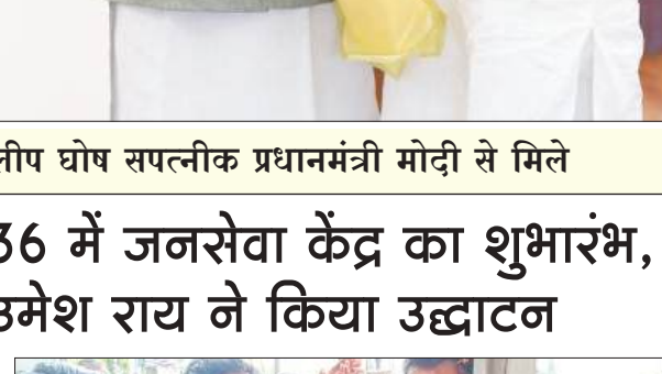
राज्य के मंत्री दिलीप घोष सपत्नीक प्रधानमंत्री मोदी से मिले