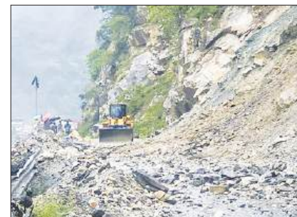
पहाड़ी राज्यों में बारिश का कहर, भूस्खलन से राजमार्ग बंद पृष्ठ 7

कोलकाता, आषाढ़ कृष्णपक्ष द्वादशी, वि.स. 2083, पृष्ठ 8, मूल्य 3.00 रुपये सुविचार : छोटे कदम, बड़ी मंजिल की ओर यह प्रयास आपको आगे बढ़ाता है।