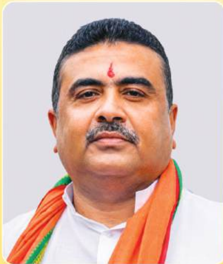
श्री शुभेंदु अधिकारी माननीय मुख्य मंत्री, पश्चिम बंगाल