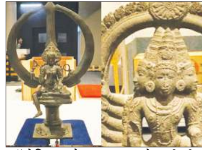
ऑस्ट्रेलिया लौटाएगा भारत से जुड़ी तीन प्राचीन कलाकृतियां पृष्ठ 7

कोलकाता, आषाढ़ कृष्णपक्ष दशमी, वि.स. 2083, पृष्ठ 8, मूल्य 3.00 रुपये सुविचार : फूल गवाह है कि अक्सर तोड़े वही जाते हैं जो अच्छे होते हैं।