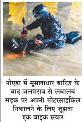
नोएडा में मूसलाधार बारिश के बाद जलभराव से लबावल सड़क पर अपनी मोटरसाइकिल निकालने के लिए जुड़ता एक बाइक सवार

नई दिल्ली : देश के कई हिस्सों में गुरुवार को हुई मूसलाधार मानसूनी बारिश ने व्यापक तबाही मचाई। दिल्ली, महाराष्ट्र, उत्तराखंड, राजस्थान, हिमाचल प्रदेश, केरल तथा राष्ट्रीय राजधानी क्षेत्र (एन-सीआर) में जलभराव, भूस्खलन, सड़क धंसे और बाढ़ जैसी घटनाओं से जनजीवन बुरी तरह प्रभावित हुआ। कई स्थानों पर पेड़ उखड़ गए, यातायात ठप हो गया और लोगों को भारी परेशानी का सामना करना पड़ा। दिल्ली में इस मानसूनी सबसे तेज बारिश दर्ज की गई। भारत मौसम विज्ञान विभाग (आईएमडी) ने राजधानी के लिए रेड अलर्ट जारी किया। विकास मार्ग, आईटीओ, मुनिरका, द्रांका, जंगपुरा और नई दिल्ली रेलवे स्टेशन सहित कई इलाकों में जलभराव से लंबा जाम लगा। मुख्यमंत्री रेखा गुप्ता ने प्रभावित क्षेत्रों का दौरा कर अधिकारियों को जल निकासी तेज करने के निर्देश