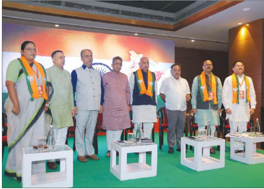
कोलकाता के ऑल्ट एयर होटल में आयोजित प्रदेश भाजपा के क्षेत्रीय प्रशिक्षण शिबिर में केंद्र और राज्य के सभी शीर्ष नेताओं ने प्रधानमंत्री नरेंद्र मोदी के 'मन की बात' कार्यक्रम को सुना।

की कोशिश कर रहे हैं कि चारों लोग फ्लैट में क्यों इकट्ठा हुए थे। पुलिस सूत्रों के अनुसार, परिसर से बड़ी मात्रा में सिंधि मादक पदार्थ भी बरामद किए गए हैं। कोलकाता पुलिस के एक वरिष्ठ अधिकारी ने बताया कि गोल्फ ग्रीन स्थित एक फ्लैट से एक पुरुष और एक महिला के शव बरामद किए गए हैं। फ्लैट में मौजूद दो लोगों को गिरफ्तार कर लिया गया है। शवों को पोस्टमार्टम के लिए भेजा गया है। रिपोर्ट आने के बाद मौत का कारण पता चलेगा। घटना के बारे में अधिक जानकारी प्राप्त करने के लिए गिरफ्तार लोगों से पूछताछ की जा रही है। जांच जारी है।