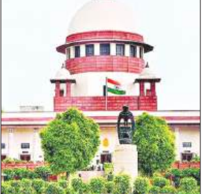
डराने, धमकाने या बलहाने-फुसलाने जैसे हथकंडों का इस्तेमाल किया हो या नहीं। कोर्ट का पूरा ध्यान अपराधियों की कर्तृताओं और उनकी नीयत पर होना चाहिए। यदि पीड़ित को यह पता भी हो कि उसे वेश्यावृत्ति में धकेला जा रहा है, तब भी वह पीड़ित ही रहेगी, क्योंकि काम के हालातों को लेकर उसे धोखे में रखा जा सकता है। कोर्ट ने कहा कि संविधान का अनुच्छेद 23 मानव तस्करी पर पूरी तरह रोक

नई दिल्ली : सुप्रीम कोर्ट ने बाल यौन शोषण और मानव तस्करी के खिलाफ एक बेहद संवेदनशील और महत्वपूर्ण फैसला सुनाया है। कोर्ट ने स्पष्ट कर दिया है कि यदि व्यावसायिक यौन शोषण के लिए किसी नाबालिग की तस्करी की जाती है, तो दोषियों पर कठोर 'पोक्सो एक्ट' के तहत मुकदमा चलाया जाएगा। जस्टिस जे.बी. पाटीलवाला और जस्टिस आर. महादेवन की पीठ ने एनजीओ 'प्रचला' की याचिका पर यह अहम फैसला सुनाते हुए कहा कि बाल यौन शोषण का बुरा मामला कानूनन गैर-सहमति वाला ही माना जाएगा।