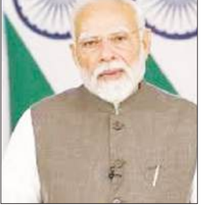
नयी दिल्ली : प्रधानमंत्री नरेन्द्र मोदी ने देशभर में तापमान बढ़ने के मद्देनजर लोगों से पर्याप्त मात्रा में पानी पीते रहने की रविवार को अपील की। मोदी ने रेडियो पर प्रसारित अपने मासिक कार्यक्रम 'मन की बात' में कहा कि लोगों को धूप में बाहर निकलते समय अतिरिक्त सावधानी बरतनी चाहिए। उन्होंने कहा, "देश के कई हिस्सों में तापमान तेजी से बढ़ रहा है। ऐसे में

कार्यरत थे। वह पिछले वर्ष 31 जुलाई को उप सेना प्रमुख के पद से सेवानिवृत्त हुए थे। पदभार संभालने के तुरंत बाद सैन्य अधिकारी ने कहा कि सशस्त्र बलों में बदलाव और तीनों सेनाओं के बीच समन्वय एवं एकीकरण बढ़ाने के लिए संगठनात्मक सुधार उनकी प्राथमिकता होंगे। उन्होंने मीडिया के समक्ष जारी एक संक्षिप्त बयान में कहा कि सशस्त्र बलों में स्वदेशी हथियारों के विकास, उन्हें शामिल करने और उनके एकीकरण की प्रक्रिया को तेज किया जाएगा। उन्होंने कहा, "हमारी सशस्त्र सेनाओं ने राष्ट्रीय हितों की रक्षा में हमेशा पेशेवर दक्षता और निर्णायक सैन्य क्षमता का परिचय दिया है। हम देश की संप्रभुता और क्षेत्रीय अखंडता की रक्षा के लिए प्रतिबद्ध हैं।"