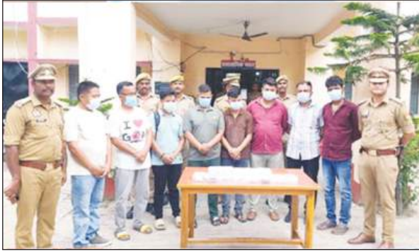
पहुंचने पर उनसे कथित तौर पर प्रशिक्षण, पंजीकरण और अन्य प्रोसेसिंग शुल्क के नाम पर जबन धन वसूली करते थे। जांच के दौरान पुलिस ने गिरोह के चंगुल से 453 नेपाली नागरिकों को बचाया और उन्हें सुरक्षित

गोरखपुर (उप्र): कुशीनगर पुलिस ने नेपाली नागरिकों को कथित तौर पर नौकरी, उच्च शिक्षा और नेटवर्क मार्केटिंग के जरिए मोटी कमाई का झांसा देकर अपने जाल में फंसेने वाले एक अंतरराष्ट्रीय ठगी गिरोह का भंडाफोड़ किया है। अधिकारियों ने रविवार को यह जानकारी दी। पुलिस ने बताया कि कुशीनगर के कसया कस्बे में चलाए गए एक अभियान के दौरान दो महिलाओं समेत गिरोह के 10 सदस्यों को गिरफ्तार किया गया। पुलिस के अनुसार गिरोह के सदस्य नेपाल के अलग-अलग हिस्सों से आर्थिक रूप से कमजोर और कम पढ़े-लिखे लोगों को रोजगार और शिक्षा के अवसरों का बहाने कुशीनगर आने के लिए लुभाते थे और वहां