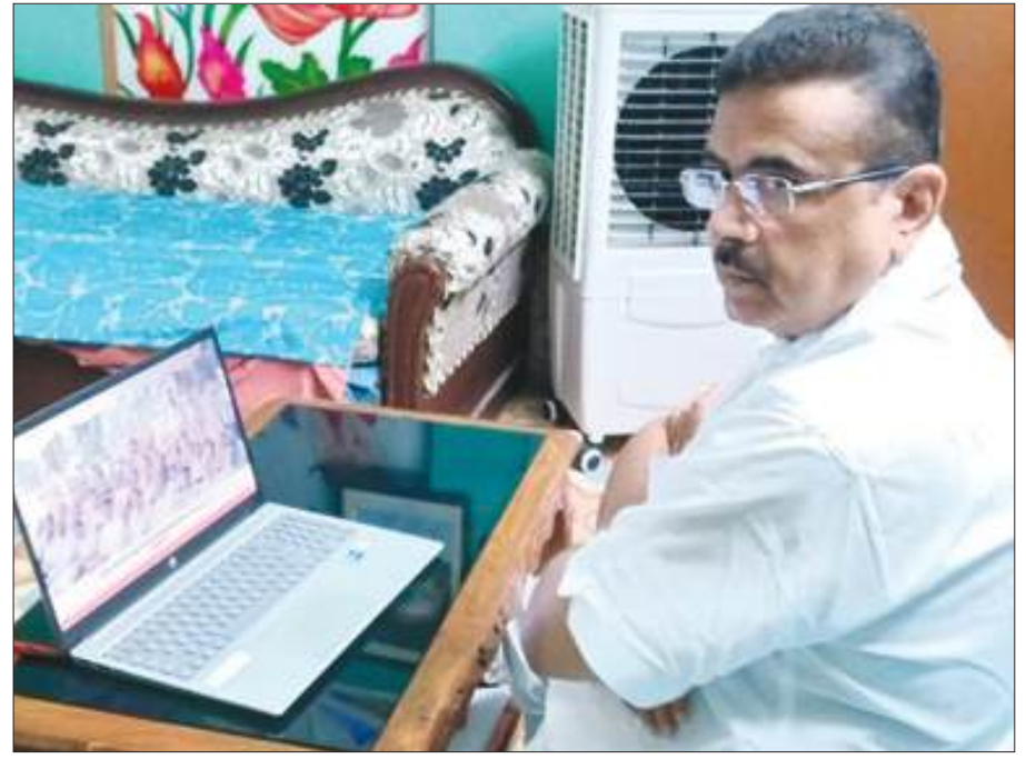
मुख्यमंत्री शुभेंद्रु अधिकारी प्रधानमंत्री नरेंद्र मोदी के 'मन की बात' कार्यक्रम को सुनते हुए

घोषित किया गया है, वहां अवैध निर्माण के लिए गिरोहों द्वारा गांवों या झुग्गी-झोपड़ी वाले इलाकों को ध्वस्त किए जाने की संभावना है। सूत्रों के अनुसार, इन अवैध निर्माणों में तृणमूल कांग्रेस के कई नेताओं के नाम भी सामने आ रहे हैं। राज्य में सत्ता परिवर्तन के बाद शासन से मिले आदेश पर केएमसी प्रशासक अवैध निर्माणों की पहचान करने के लिए शहर की निगरानी कर रहे हैं। तिलजला, बेलियाघाटा और कस्बा क्षेत्रों में तृणमूल कांग्रेस के नेताओं के समर्थन से बने अवैध निर्माणों को खिलाफ बुलडोजर कार्रवाई जारी है।