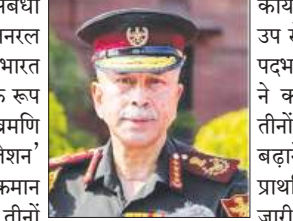
कार्यरत थे। वह पिछले वर्ष 31 जुलाई को उप सेना प्रमुख के पद से सेवानिवृत्त हुए थे। पदभार संभालने के तुरंत बाद सैन्य अधिकारी ने कहा कि सशस्त्र बलों में बदलाव और तीनों सेनाओं के बीच समन्वय एवं एकीकरण बढ़ाने के लिए संगठनात्मक सुधार उनकी प्राथमिकता होंगे। उन्होंने मीडिया के समक्ष जारी एक संक्षिप्त बयान में कहा कि सशस्त्र बलों में स्वदेशी हथियारों के विकास, उन्हें शामिल करने और उनके एकीकरण की प्रक्रिया को तेज किया जाएगा। उन्होंने कहा, "हमारी सशस्त्र सेनाओं ने राष्ट्रीय हितों की रक्षा में हमेशा पेशेवर दक्षता और निर्णायक सैन्य क्षमता का परिचय दिया है। हम देश की संप्रभुता और क्षेत्रीय अखंडता की रक्षा के लिए प्रतिबद्ध हैं।"

नयी दिल्ली : पाकिस्तान और चीन संबंधी मामलों के विशेषज्ञ माने जाने वाले जनरल एन एस राजा सुब्रमणि ने रविवार को भारत के नए प्रमुख रक्षा अध्यक्ष (सीडीएस) के रूप में पदभार संभाल लिया। जनरल सुब्रमणि के सामने महत्वाकांक्षी सैन्य 'थिएटराइजेशन' (सेना के तीनों अंगों की एकीकृत सैन्य कमान व्यवस्था) योजना को लागू करने और तीनों सेनाओं के बीच समन्वय मजबूत करने की प्रमुख जिम्मेदारी होगी। जनरल सुब्रमणि ने जनरल अनिल चौहान का स्थान लिया है, जिन्होंने शांतिवार को देश के वरिष्ठतम सैन्य कमांडर के रूप में अपना कार्यकाल पूरा किया। जनरल सुब्रमणि इससे पहले राष्ट्रीय सुरक्षा परिषद सचिवालय (एनएससीएस) में सैन्य सलाहकार के रूप में