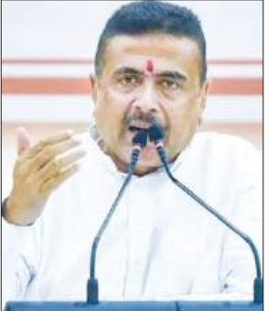
की एक पूर्ण मंत्रिपरिषद का सोमवार को गठन किया जाएगा। सूत्रों के अनुसार, इस विस्तार में उत्तर बंगाल, जंगलमहल और मत्तुआ बहुल क्षेत्रों के विधायकों को मंत्रिमंडल में बड़ी जिम्मेदारी मिल

पहला बड़ा विस्तार सोमवार, एक जून को करने जा रहे हैं। नौ मई को मुख्यमंत्री पद की शपथ लेने के बाद से ही इस बात की चर्चाएं तेज थीं कि शुभेंद्रु कैबिनेट (मंत्रिमंडल) में नए चेहरों को कब जगह मिलेगी। अब इस पर से स्पष्ट पूरी तरह हट चुका है। मुख्यमंत्री शुभेंद्रु ने रविवार को खुद एक्स पर एक पोस्ट में जानकारी दी कि नवगठित राज्य मंत्रिमंडल का सोमवार को शपथ ग्रहण समारोह होगा। 35 नए मंत्री शपथ लेंगे। शपथ समारोह सुबह 11 बजे से लोकभवन में होगा। राज्यपाल आरएन रवि नए मंत्रियों को शपथ दिलाएंगे। शुभेंद्रु ने लिखा कि बंगाल की जनता के जनादेश के अनुरूप चुनी हुई राष्ट्रवादी सरकार