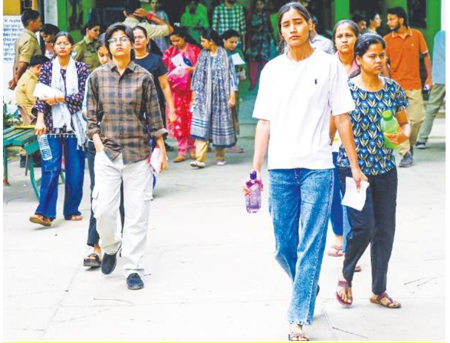
यूपी बीएड प्रवेश परीक्षा के बाद केंद्र से बाहर आते परीक्षार्थी