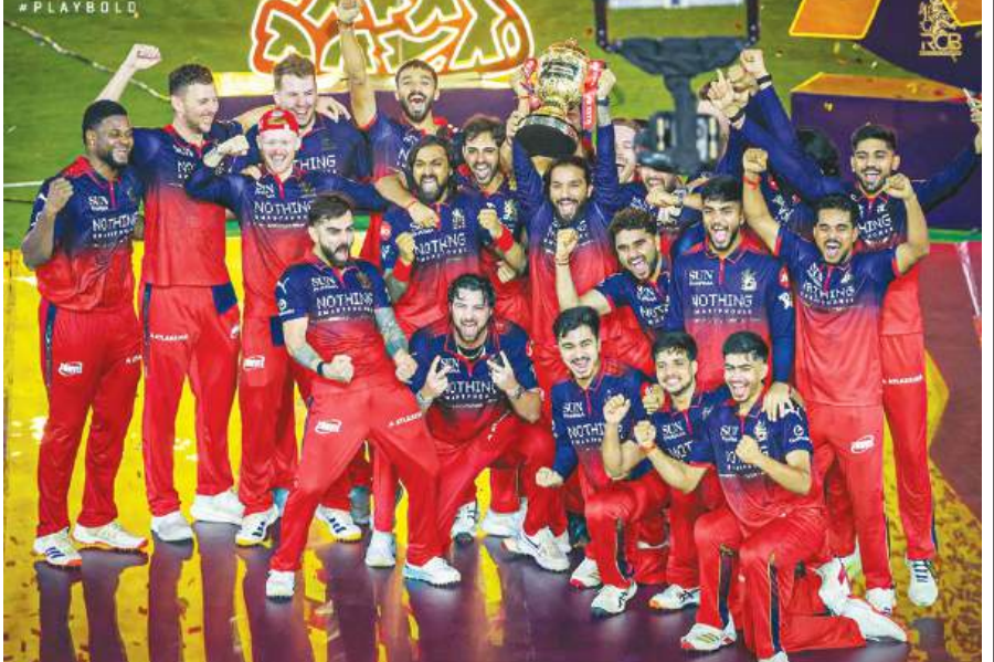
गुजरात के गढ़ में आरसीबी की ऐतिहासिक जीत, लगातार दूसरी बार चैंपियन पृष्ठ 8