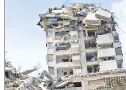
वेनेजुएला में भूकंप से 188 लोगों की मौत, 200 से ज्यादा लोग मलबे में फंसे पृष्ठ 2

सुविचार : रिश्तों की गिनती नहीं उनकी गुणवत्ता मायने रखती है।