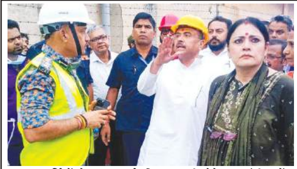
बचाव कर्मियों से राहत कार्य की जानकारी लेते मुख्यमंत्री शुभेंदु अधिकारी एवं मंत्री अग्निमित्रा पाल

के शासनकाल के दौरान केएमसी से मंजूरी मिली थी। शुभेंदु अधिकारी ने कहा कि मैंने जो देखा, उससे मुझे पूरा यकीन हो गया है कि यह हादसा बारिश या कमजोर मिट्टी के कारण नहीं हुआ है, जिस पर यह निर्माण किया जा रहा था। यह खराब ढांचागत डिजाइन की वजह से हुआ, जिसमें लोहे के खंभे कंक्रीट का वजन नहीं संभाल पाए और भ्रष्टाचार जमीन पर गिर गए। उन्होंने कहा कि मैंने केएमसी आयुक्त और शहरी विकास एवं नगर नियोजन विभाग को पिछली सरकार द्वारा अनुमोदित सभी निर्माणाधीन परियोजनाओं, विशेष रूप से व्यावसायिक इमारतों पर काम रोकने का निर्देश दिया है। इन सभी का ऑडिट किया जाएगा। ऐसे स्थलों पर निर्माण कार्य 31 जुलाई तक निलंबित रहेगा। अधिकारी ने कहा कि जांच में सही पाए जाने की शर्त पर, इन स्थलों पर एक अगस्त से काम दोबारा शुरू किया जा सकेगा। उन्होंने बताया कि इसके बाद इस ऑडिट का दायरा हावड़ा और विधाननगर नगर निगम क्षेत्रों तक भी बढ़ाया जाएगा। मुख्यमंत्री ने कहा कि यह ऑडिट एक बहु-एजेंसी टीम द्वारा किया जाएगा, जिसमें लोक निर्माण विभाग (पीडब्ल्यूडी), नागरिक सुरक्षा, अग्निशमन सेवा, कोलकाता पुलिस और केएमसी के अधिकारी शामिल होंगे। उन्होंने कहा कि यह टीम मुख्य सचिव के मार्गदर्शन में काम करेगी। यह टीम