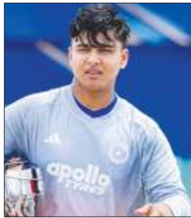
था। भारत का ब्रिटेन दौरा शुक्रवार से बेलफास्ट में आयरलैंड के खिलाफ दो मैचों की टी20 श्रृंखला से शुरू होगा, जिसके बाद अगले बुधवार से इंग्लैंड के खिलाफ पांच मैचों की टी20 श्रृंखला खेली

नयी दिल्ली : किशोर बल्लेबाज वैभव सूर्यवंशी अपने पहले सीनियर अंतरराष्ट्रीय दौर पर एक अनोखे अनुभव से गुजरने वाले हैं जहां इस 15 वर्षीय इस खिलाड़ी को भारत के आगामी इंग्लैंड टी20 अंतरराष्ट्रीय श्रृंखला के दौरान सुरक्षा संबंधी नियमों के तहत अलग 'चेंजिंग रूम' दिया जाएगा। अपनी आक्रामक बल्लेबाजी से पहले ही सुर्खियां बटोर चुके सूर्यवंशी पदार्पण का मौका मिलने पर भारत के सबसे युवा अंतरराष्ट्रीय क्रिकेटर बन जायेंगे। वह इस मामले में महान बल्लेबाज सचिन तेंदुलकर का रिकॉर्ड तोड़ सकते हैं, जिन्होंने 1989 में 16 वर्ष और 205 दिन की उम्र में टेस्ट पदार्पण किया