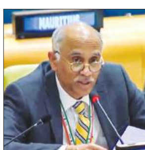
को पाटना: सुरक्षा परिषद के प्रस्ताव और अंतरराष्ट्रीय शांति एवं सुरक्षा बनाए रखना' विषय पर आयोजित अर्रिया-फॉर्मूला बैठक में पाकिस्तान