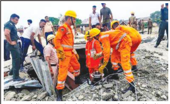
राहत कार्य में तत्परता से जुटे सेना के साथ डिजास्टर मैनेजमेंट, एनडीआरएफ, फ़ायर ब्रिगेड और पुलिस की टीम

अपनी रिपोर्ट सौंपने से पहले स्थल योजना, भवन नक्शों की जांच करेगी और मौके पर जाकर निरीक्षण करेगी।