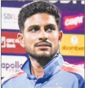
था जिसका उन्हें फायदा मिला है। उन्हें अंतिम मैच में बल्लेबाजी का मौका नहीं मिला लेकिन उन्होंने पहले दो मैचों में 84 और 154 रन

दुबई : भारतीय कप्तान शुभमन गिल बुधवार को अंतरराष्ट्रीय क्रिकेट परिषद (आईसीसी) की वनडे में बल्लेबाजों की रैंकिंग में तीन पायदान ऊपर दूसरे स्थान पर पहुंच गए, जबकि न्यूजीलैंड के तेज गेंदबाज मैट हेनरी भारत के जसप्रीत बुमराह के साथ टेस्ट क्रिकेट में दुनिया के नंबर एक गेंदबाज बन गए हैं। गिल अब न्यूजीलैंड के डैरिल मिशेल से केवल 24 रेटिंग अंक पीछे हैं। भारतीय कप्तान ने अफगानिस्तान के खिलाफ हाल में समाप्त हुई तीन मैचों की वनडे श्रृंखला में अच्छा प्रदर्शन किया