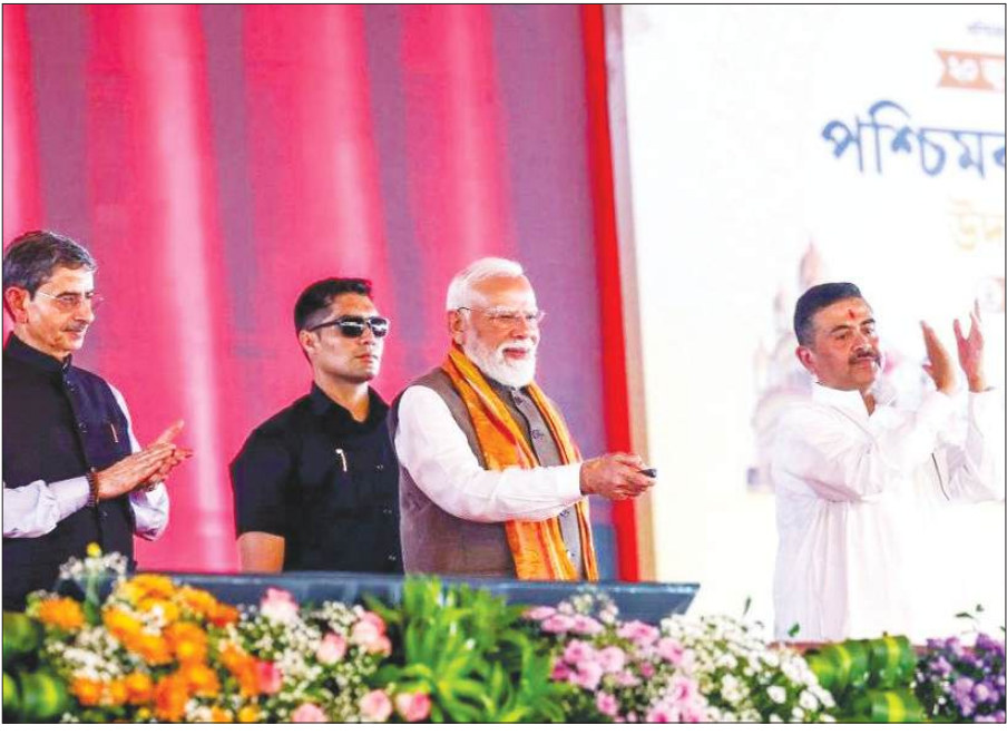
तारकेश्वर में आयोजित 'पश्चिमबंग दिवस' समारोह से पीएम मोदी बटन दबाकर कई परियोजनाओं का उद्घाटन एवं शिलान्यास करते