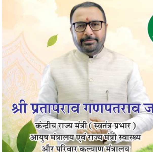
श्री प्रतापराव गणपतराव जाधव केंद्रीय राज्य मंत्री (स्वतंत्र प्रभार) आयुष मंत्रालय एवं राज्य मंत्री स्वास्थ्य और परिवार कल्याण मंत्रालय