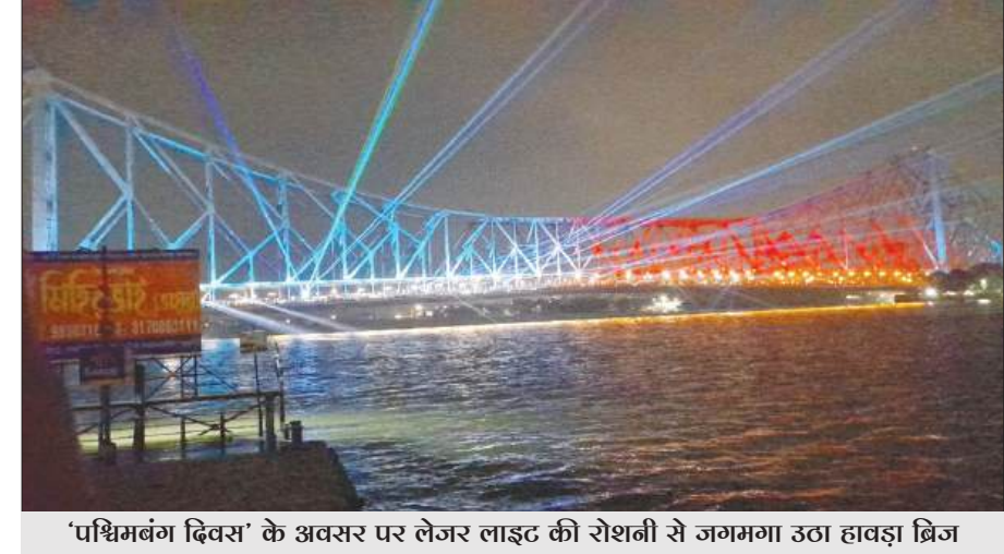
'पश्चिमबंग दिवस' के अवसर पर लेजर लाइट की रोशनी से जगमगा उठा हावड़ा ब्रिज