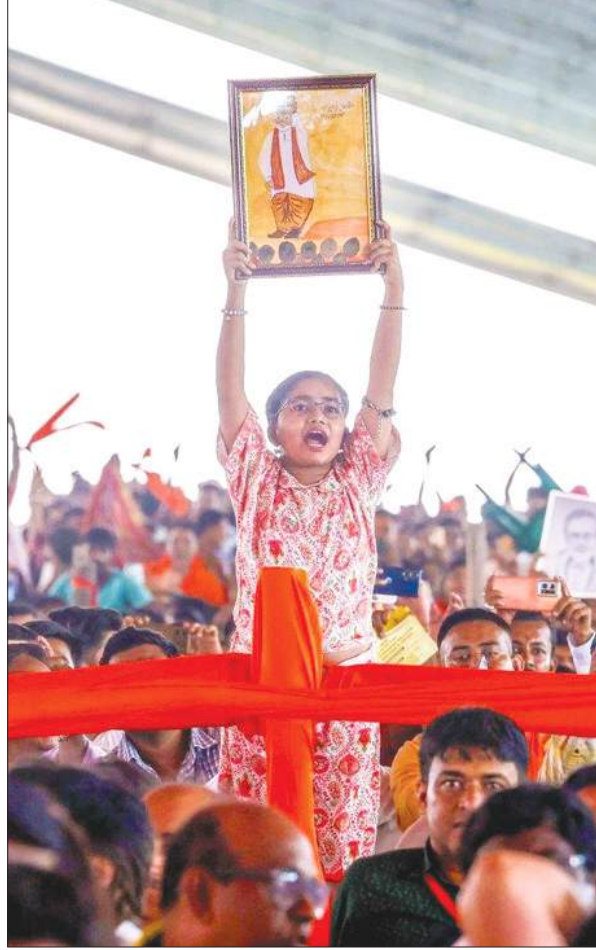
तारकेश्वर में आयोजित 'पश्चिमबंग दिवस' समारोह में भीड़ में शामिल एक बच्ची पीएम मोदी की तस्वीर दिखाती हुई