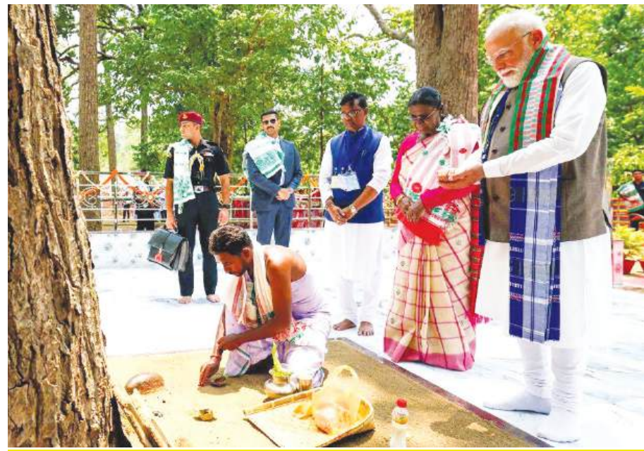
राष्ट्रपति मुर्मू, पीएम मोदी ने ओडिशा के मयूरभंज के पहाड़पुर गांव का दौरा किया

प्रसिद्ध कोणार्क सूर्य मंदिर से तुलना करते हुए, उन्होंने विश्वास व्यक्त किया कि पहाड़पुर एक आदर्श सौर-ऊर्जा संचालित गांव के रूप में विकसित होगा। उन्होंने राष्ट्रपति मुर्मू को जन्मदिन की हार्दिक शुभकामनाएं दीं और मयूरभंज की धरती से उठकर देश के सर्वोच्च संवैधानिक पद तक उनके पहुंचने को ओडिशा और पूरे देश के लिए अत्यंत गर्व का विषय बताया। मोदी ने कहा, 'जनसेवा के प्रति उनका समर्पण, विनम्रता और राष्ट्र-निर्माण के प्रति प्रतिबद्धता सराहनीय है। उनकी उपस्थिति प्रेरणा देती है और विशेष रूप से आदिवासी, वंचित और हाशिए पर रहने वाले समुदायों को पराकार्य में आत्मविश्वास तथा महत्वाकांक्षा का संचार करती है।' उन्होंने कहा कि ओडिशा के पास एक समृद्ध राज्य बनने के लिए सभी आवश्यक तत्व मौजूद हैं, जिनमें तटरेखा, खनिज, कृषि और सबसे बढ़कर युवाओं की क्षमता शामिल है। उन्होंने कहा कि रेलवे, सड़क, बंदरगाह, बिजली, सेमीकंडक्टर और हरित ऊर्जा जैसे क्षेत्रों में समग्र प्रगति हुई है। उन्होंने कहा कि लोगों को 'डबल इंजन' सरकार के लाभ अब अपने दैनिक जीवन में मिलने लगे हैं। मोदी ने कहा कि 'उत्कर्ष ओडिशा अभियान' के माध्यम से राज्य को 20 लाख करोड़ रुपये के निवेश प्रस्ताव प्राप्त हुए हैं, जिनमें से 3.5 लाख करोड़ रुपये की परियोजनाओं पर कार्य किया जा रहा है।