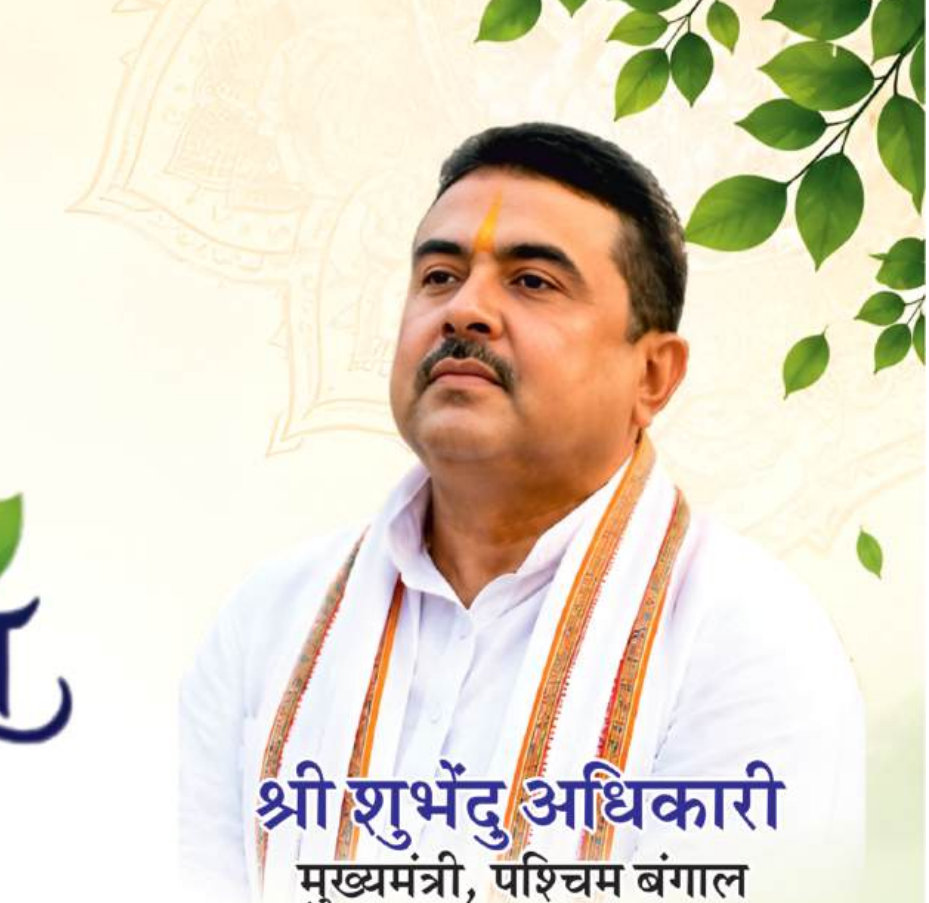
श्री शुभेंदु अधिकारी मुख्यमंत्री, पश्चिम बंगाल