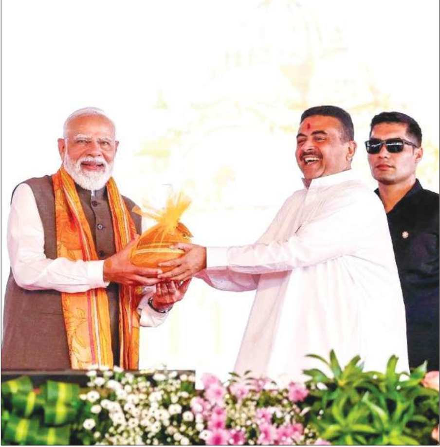
मुख्यमंत्री शुभेंद्रु अधिकारी पीएम मोदी को बाबा तारकनाथ की तस्वीर व डोकरा शैली की देवी दुर्गा की मूर्ति के अलावा बंगाल के प्रसिद्ध रसगुल्ले और चंदननगर की प्रसिद्ध जल भरा मिठाइयां भेंट करते

28,140 करोड़ रुपये के अनुमानित बीमित मूल्य वाली फसलों की सुरक्षा होगी तथा किसानों को पर्याप्त महत्वपूर्ण सब्सिडी के माध्यम से सहायता मिलेगी। मोदी ने लगभग 590 करोड़ रुपये की महत्वपूर्ण रेलवे परियोजनाओं को भी राष्ट्र को समर्पित किया तथा इनकी आधारशिला रखी। उन्होंने प्रधानमंत्री ग्राम सड़क योजना (पीएमजीएसवाई-तृतीय) के तहत विकसित 49 सड़क अवसंरचना परियोजनाओं का उद्घाटन किया, जिसके दायरे में राज्य के विभिन्न जिलों में कुल मिलाकर 315 किलोमीटर से अधिक का क्षेत्र आता है।