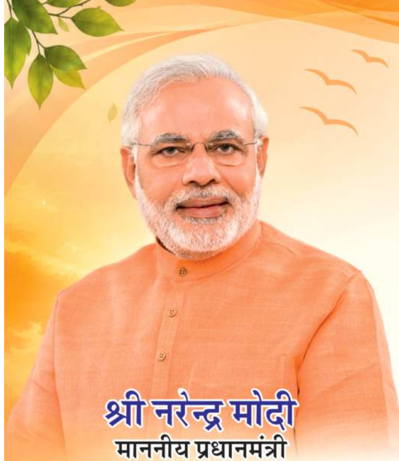
श्री नरेन्द्र मोदी माननीय प्रधानमंत्री