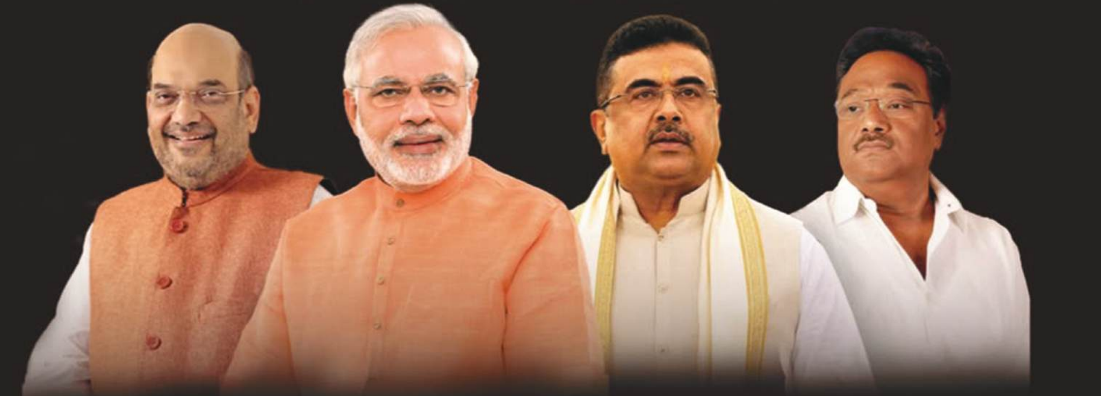
श्री अमित शाह माननीय केंद्रीय गृह मंत्री

पश्चिम बंगाल दिवस की हार्दिक शुभकामनाएँ एवं बधाई।