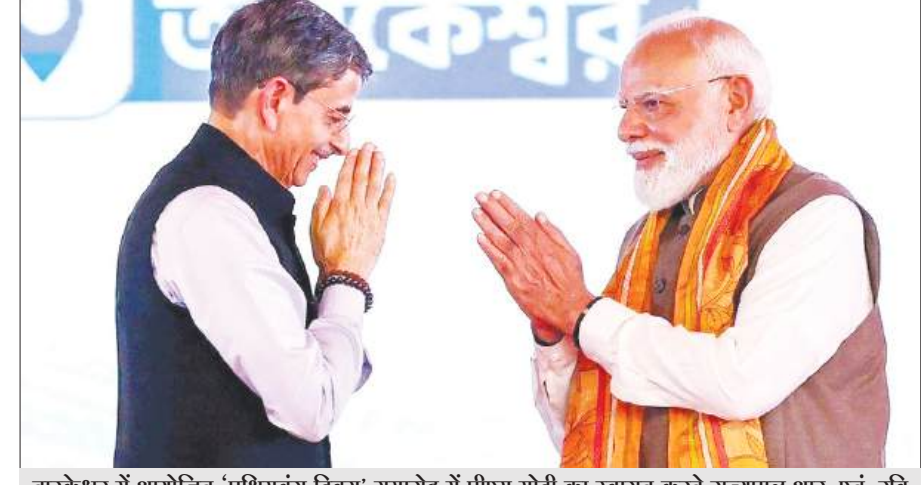
तारकेश्वर में आयोजित 'पश्चिमबंग दिवस' समारोह में पीएम मोदी का स्वागत करते राज्यपाल आर. एन. रवि