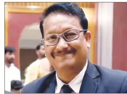
कोच जसपाल राणा के निधन से भारतीय खेल जगत को बड़ी क्षति, राष्ट्रपति-प्रधानमंत्री ने दी श्रद्धांजलि पृष्ठ 8