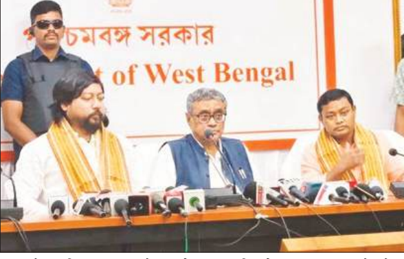
बजट तैयार किया जा रहा है। पहले की तरह नहीं, जब ट्रेडमिल पर दोड़ते हुए बजट बनता था। उत्तर बंगाल के व्यवसायियों की एक लंबे समय से मांग थी कि जीएसटी से जुड़ी समस्याओं के समाधान के लिए उन्हें बार-बार कोलकाता भागना पड़ता था, जिससे उनका समय और पैसा दोनों बर्बाद होता था। इस दिन, इस समस्या का स्थायी समाधान करते हुए वित्त मंत्री स्वपन दासगुप्ता ने बड़ा आश्वासन दिया। उन्होंने कहा कि आगामी बजट सत्र में वे उत्तर बंगाल में ही एक स्वतंत्र 'जीएसटी

उत्तर बंगाल को मिलेगी विशेष प्राथमिकता, विकास पर जोर जीएसटी अपीलीय ट्रिब्यूनल और कर छूट की मांग उठी सिलीगुड़ी : राज्य में सत्ता परिवर्तन के बाद नई भाजपा सरकार अपने पहले बजट सत्र की तैयारियों में पूरी ताकत से जुट गई है। आगामी 22 जून को राज्य का बजट पेश होना है। इस ऐतिहासिक बजट से पहले राज्य के नए वित्त मंत्री स्वपन दासगुप्ता ने उत्तर बंगाल के व्यापारियों और उद्योगपतियों की नब्ज टटोलने के लिए सिलीगुड़ी का दौरा किया। गुर्वार को उत्तरकन्या में पूर्व बजट बैठक करने के बाद वित्त मंत्री ने पिछली तृणमूल कांग्रेस सरकार पर तीखा तंज कसा। उन्होंने कहा कि इस बार पहली बार जनता और व्यापारियों से सीधे बात करके