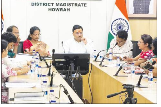
बैठक में संबंधित अधिकारियों को निर्देश दिया गया कि वे सेवा वितरण प्रणाली को और अधिक मजबूत बनाने तथा जनता की समस्याओं के त्वरित समाधान के लिए आवश्यक कदम उठाएं। यह

हावड़ा, समाज्ञा : हावड़ा जिला प्रशासन ने गुर्वार को डीएम कार्यालय में सार्वजनिक वितरण प्रणाली (पीडीएस) की कार्यप्रणाली की समीक्षा की। राज्य मंत्री उमेश राय द्वारा आयोजित इस बैठक में इस बात पर विशेष जोर दिया गया कि सभी लाभार्थियों को निर्धारित मात्रा में तथा समय पर राशन उपलब्ध हो। समीक्षा बैठक के दौरान 'दुआरे सरकार' कार्यक्रम के क्रियान्वयन में सामने आई विभिन्न कर्मियों और सीमाओं पर भी चर्चा की गई। प्रशासन ने आम लोगों तक सरकारी सेवाओं को अधिक प्रभावी और सुगम ढंग से पहुंचाने के लिए वैकल्पिक एवं बेहतर व्यवस्थाएं अपनाने की आवश्यकता पर बल दिया।