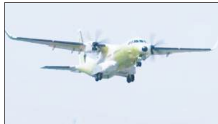
करती है तथा 'आत्मनिर्भर भारत' के दृष्टिकोण के तहत स्वदेशी रक्षा क्षमता को बढ़ावा देने के प्रति भारतीय वायुसेना की प्रतिबद्धता को रेखांकित करती है।

नयी दिल्ली : भारत में निर्मित पहले सी-295 सैन्य परिवहन विमान ने सफलतापूर्वक अपनी पहली परीक्षण उड़ान पूरी की। भारतीय वायुसेना (आईएएफ) ने यह जानकारी दी। भारतीय वायुसेना लगभग 21,935 करोड़ रुपये की लागत से 56 सी-295 परिवहन विमान खरीद रही है। इनमें से 40 विमानों का निर्माण बड़ोदरा स्थित उत्पादन केंद्र में 'टाटा एडवांस्ड सिस्टम्स लिमिटेड' द्वारा 'एयरबस' के सहयोग से किया जाएगा। भारतीय वायुसेना ने भारत में निर्मित पहले सी-295 विमान की सफल पहली परीक्षण उड़ान के लिए इससे जुड़े पूरे दल को बधाई दी। वायुसेना ने बुधवार को कहा, यह उपलब्धि भारत की बढ़ती एयरोस्पेस क्षमताओं को और मजबूत