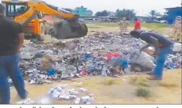
स्वास्थ्य सेवाओं से जुड़ी सामग्री और ऑक्सीजन सिलेंडर बरामद हुए। घटना की जानकारी फैलते ही बड़ी संख्या में स्थानीय लोग मौके पर पहुंच गए। भाजपा का आरोप है कि बरामद की गई सामग्री हाल ही में आयोजित तथाकथित 'सेवाश्रय कैम्प' के लिए लाई गई थी। इस मामले को लेकर भाजपा ने तृणमूल कांग्रेस पर बड़े