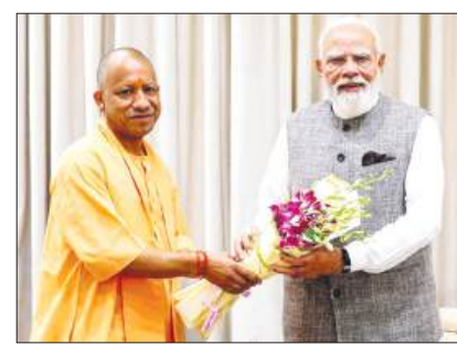
प्रधानमंत्री नरेंद्र मोदी ने नई दिल्ली में उत्तर प्रदेश के मुख्यमंत्री योगी आदित्यनाथ से मुलाकात की।