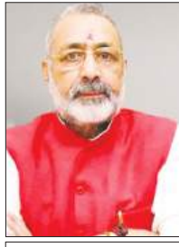
श्री गिरिराज सिंह

फाइबर के साथ भारत का 5,000 बरस-पुराना सभ्यतागत संबंध है, जो हमारे गाँवों, परंपराओं तथा सामूहिक पहचान में गहराई सेगूँथा है। बुनी हुई हवाकहलाने वालीमोहनजोदड़ों की प्रसिद्ध मलमल से लेकरसमस्त महाद्वीपों तक फैलीभारतीय कारीगरी तक - फाइबर हमेशासेहमारी ग्रामीण अर्थव्यवस्था की जीवन्रेखा रहा है। आज,जब दुनिया वैश्विकस्थिरताकी क्रांतिकी कारगरपर खड़ी है,तब यही प्राचीन ज्ञान हमारी सबसे बड़ी प्रतिस्पर्धात्मक शक्ति है। दशकों तक केले के पेड़ के तने को बेकार अपशिष्ट मानकर फेंक दिया जाता था। आज वही बायोमास प्रीमियम फाइबर बनकर निर्यात बाजारों की मांग पूरी कर रहा है,ग्रामीण आजीविकाओं को सशक्त बना रहा है औरइसकृषि अवशेष को राष्ट्रीय आय में बदल रहा है। अपशिष्ट से समृद्धि तक,स्थानीय प्रचुरता से वैश्विक अवसर तक - यही भारत की न्यू एज फाइबर मुहिम का सार है,जो हरित सामग्रियों और भविष्य के लिए तैयार वस्त्रों में भारत को वैश्विक नेतृत्व की ओर अग्रसर कर रहा है। न्यू एज फाइबर ऐसेटिकाऊएवं पौधों-आधारितपर्यायहै,जो भारत के पारंपरिक ज्ञान को आधुनिक नवाचार के साथ जोड़तेहैं। बांस, भाँग, केला, पीएएलएफ, फ्लेक्स, रेमी, सिसल, मिल्कवीड और कपोक जैसे फाइबर सद्यियों से मौजूद रहे हैं, लेकिन अब इन्हें वस्त्र उद्योग, रक्षा,