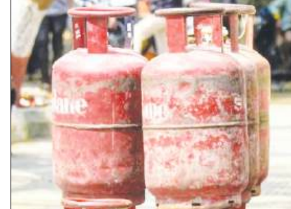
कीमतों में वृद्धि के बाद सरकार का दावा, भारत में दुनिया के अन्य देशों से सस्ता है सोई गैस सिलेंडर पृष्ठ 8

कोलकाता, आषाढ़ (अधिक) कृष्णपक्ष अष्टमी, वि.स. 2082, पृष्ठ 8, मूल्य 3.00 रुपये