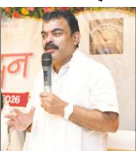
तृणमूल को हराने का और भाजपा को जीतने का। शीर्ष नेतृत्व की ताबड़ तोड़ रैलियों और निष्पक्ष चुनाव की बड़ी भूमिका इस चुनाव में रही।