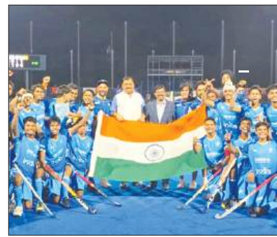
जापान को 4-1 से हराकर भारत बना पुरुष अंडर-18 एशिया कप चैंपियन पृष्ठ 9