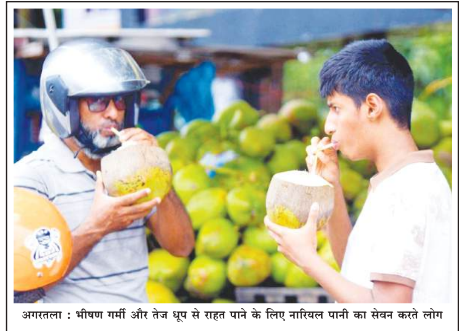
अगरतला : भीषण गर्मी और तेज धूप से राहत पाने के लिए नारियल पानी का सेवन करते लोग