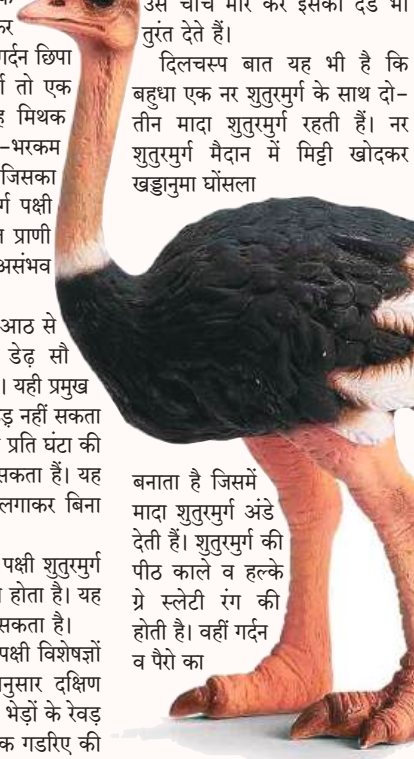
हल्का भूरा, मिट्टी,

कंकड़ के आभाव में कभी-कभी ये दूसरी कठोर व सख्त चीजों को भी निगल जाते हैं जो इन्हें हानि पहुंचा सकते हैं और कभी-कभी मौत का कारण भी बन जाते हैं। शतुरमुर्ग की औसत आयु तीस से चालीस साल तक होती है। पिछले दस-बारह सालों में इस पक्षी की संख्या में तेजी से गिरावट आई है जो पर्यावरण एवं पारिस्थितिक तंत्र के लिए अच्छा संकेत नहीं है। (उर्वशी)