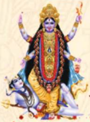
माँ काली मंदिर जीर्णोद्धार