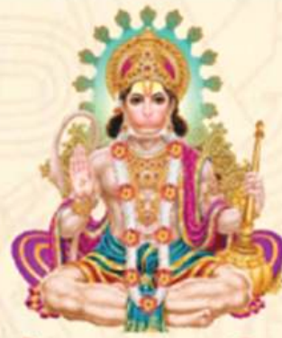
श्री हनुमान मंदिर जीर्णोद्धार