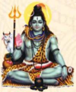
श्री शिव मंदिर जीर्णोद्धार