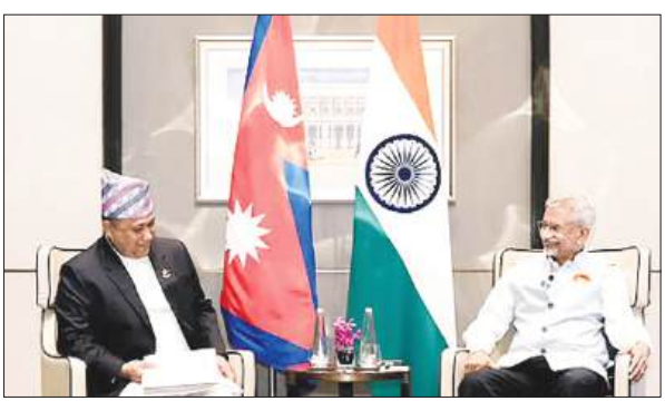
भारत के साथ अपने संबंधों को 'सर्वोच्च प्राथमिकता' देता है और बालेंद्र शाह के नेतृत्व वाली सरकार नयी दिल्ली के साथ 'ठोस और सार्थक' रूप से जुड़ने के लिए तैयार है। नेपाल के विदेश मंत्री ने कहा,

नयी दिल्ली : विदेश मंत्री एस जयशंकर ने शनिवार को अपने नेपाली समकक्ष शिशिर खनाल के साथ एक बैठक के दौरान कहा कि भारत और नेपाल एक 'विशेष' रिश्ता साझा करते हैं और इसकी पूरी क्षमता को साकार करने के लिए संबंधों को निर्यात रूप से आगे बढ़ाने पर ध्यान केंद्रित किया जाना चाहिए। खनाल ने द्विपक्षीय संबंधों को मजबूत करने के लिए शुक्रवार को भारत की तीन दिवसीय यात्रा शुरू की। इस यात्रा का उद्देश्य दोनों देशों के बीच सीमा विवाद पर नेपाल के प्रधानमंत्री बालेंद्र शाह की टिप्पणियों से उपजे विवाद के बीच संबंधों को बेहतर बनाना है। जयशंकर के साथ बैठक के दौरान खनाल ने कहा कि नेपाल