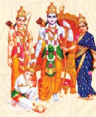
राम दरबार वार्षिक उत्सव