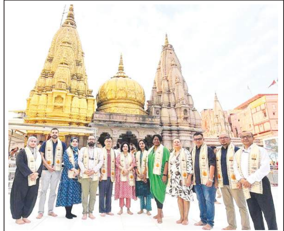
त्रिक्स देशों के प्रतिनिधियों ने काशी विश्वनाथ मंदिर में किया दर्शन, वाराणसी की सांस्कृतिक और आध्यात्मिक विरासत से हुए रूबरू

न्यायपालिका की महत्वपूर्ण भूमिका के बारे में पूछे जाने पर, न्यायमूर्ति सूर्यकांत ने कहा कि न्यायपालिका का सर्वोपरि कर्तव्य यह सुनिश्चित करना है कि संविधान में निहित सिद्धांत केवल कागज पर लिखे शब्द न हों, बल्कि इस बात की गारंटी देने जो प्रत्येक नागरिक की स्वतंत्रता की रक्षा करें।' उन्होंने कहा कि न्यायपालिका को लोगों के अधिकारों की रक्षा करने की महत्वपूर्ण जिम्मेदारी सौंपी गई है, विशेष रूप से उन लोगों की, जो हाशिये पर हैं, ताकि उन्हें किसी भी प्रकार के अत्याचार या उनके अधिकारों के हनन से बचाया जा सके।