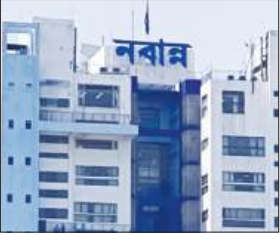
प्रायोजित योजनाओं के क्रियान्वयन तथा नई सरकार द्वारा शुरू की गई विभिन्न परियोजनाओं को शीघ्र मंजूरी

कोलकाता : राज्य में विकास परियोजनाओं, जनकल्याणकारी योजनाओं और प्रशासनिक कार्यों को तेज गति से आगे बढ़ाने के उद्देश्य से राज्य सरकार ने विभिन्न विभागों, पंचायत संस्थाओं तथा विकास परिषदों की वित्तीय शक्तियों में महत्वपूर्ण बढ़ोतरी करने का निर्णय लिया है। इस संबंध में वित्त विभाग द्वारा अधिसूचना जारी कर दी गई है। सरकारी सूत्रों के अनुसार, केंद्र