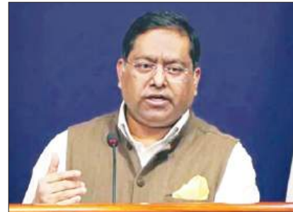
भारत ने पिलगित-बालिस्तान विधानसभा चुनाव को लेकर पाकिस्तान के समक्ष कड़ा विरोध दर्ज कराया पृष्ठ 7

कोलकाता, आषाढ़ (अधिक) कृष्णपक्ष षष्ठी, वि.स. 2082, पृष्ठ 8, मूल्य 3.00 रुपये