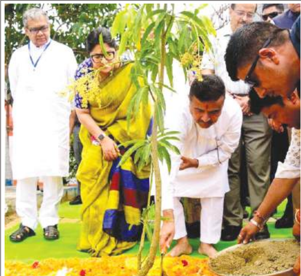
विश्व पर्यावरण दिवस के मौके पर मुख्यमंत्री शुभेंदु अधिकारी ने वृक्षारोपण किया। इस दौरान, मंत्री शंकर घोष समेत कई विधायक एवं राज्य के मुख्य सचिव मनोज अग्रवाल उपस्थित रहे

कोलकाता, समाज्ञा : मुख्यमंत्री शुभेंदु अधिकारी ने शुक्रवार को कोलकाता और उससे सटे शहरी इलाकों के 'कंक्रीट के जंगल' में बदलने पर चिंता व्यक्त की और आरोप लगाया कि पिछली सरकार के दौरान निर्माण परियोजनाओं में हरित क्षेत्रों को संरक्षित रखने संबंधी अनिवार्य नियमों की अक्सर अनदेखी की गई। साथ ही, उन्होंने चेतावनी दी कि ऐसे उल्लंघनों की पर्यावरणीय कीमत आने वाली पीढ़ियों को चुकानी पड़ेगी। इस दिन, विश्व पर्यावरण दिवस के अवसर पर राज्य सरकार के महत्वाकांक्षी वनीकरण अभियान 'एक पेड़ मां के नाम' की शुरुआत करते हुए अधिकारी ने 31 मार्च 2027 तक राज्यभर में 1.10 करोड़ पेड़ लगाने और उनका संरक्षण करने का लक्ष्य घोषित किया। बिधाननगर स्थित नलबन में आयोजित राज्य स्तरीय विश्व पर्यावरण दिवस समारोह में उन्होंने कहा कि वृद्ध कोलकाता क्षेत्र धीरे-धीरे कंक्रीट के जंगल में बदलता जा रहा है। शहर का विस्तार स्वाभाविक है, लेकिन पर्यावरणीय चिंताओं को अक्सर नजरअंदाज किया जा रहा है।