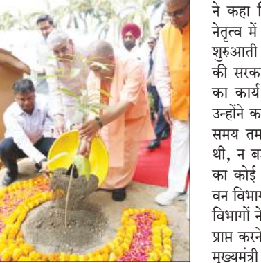
लखनऊ: उत्तर प्रदेश के मुख्यमंत्री योगी आदित्यनाथ ने शुक्रवार को कहा कि पिछले नौ वर्षों के दौरान राज्य में वन महत्वत्व के अवसर पर पौधारोपण के क्रम में अब तक 242 करोड़ पौधे लगाने के एक बड़े कार्यक्रम को सफलतापूर्वक आगे बढ़ाया जा चुका है। योगी ने कहा, प्रधानमंत्री नरेन्द्र मोदी ने प्रकृति और मातृभूमि के प्रति अपने दायित्वों का निर्वहन करते हुए 'एक पेड़ मां के नाम' कार्यक्रम के अंतर्गत नौ वर्षों में प्रदेश के अंदर वन महत्वत्व के अवसर पर पौधारोपण के क्रम में अब तक 242 करोड़ पौधे लगाने के एक बड़े कार्यक्रम को सफलतापूर्वक आगे बढ़ाया जा चुका है। विश्व पर्यावरण दिवस-2026 के मौके पर यह आयोजित कार्यक्रम को संबोधित करते हुए योगी आदित्यनाथ