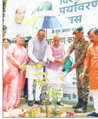
लखनऊ: रक्षा मंत्री राजनाथ सिंह ने शुक्रवार को कहा कि भारत अब 'कमजोर भारत' नहीं रहा बल्कि एक मजबूत और विश्वसनीय राष्ट्र के रूप में उभरा है। सिंह ने यहां विश्व पर्यावरण दिवस के अवसर पर लखनऊ छावनी स्थित कस्तूरबा पार्क में 'एक पेड़ मां के नाम' अभियान के तहत

लखनऊ: रक्षा मंत्री राजनाथ सिंह ने शनिवार को 'ऑपरेशन सिंदूर' में स्वदेशी हथियारों के इस्तेमाल का हवाला देते हुए ऊर्जा, ईंधन और प्रौद्योगिकी के क्षेत्रों में आत्मनिर्भरता हासिल करने पर जोर दिया। सिंह ने कहा, पिछले साल पहलगाम (जम्मू-कश्मीर) में कायतापूर्ण हमले के बाद हमारे तीन सशस्त्र बलों ने संयुक्त रूप से 'ऑपरेशन सिंदूर' को अंजाम दिया था। हमने पाकिस्तान में आतंकी ढांचे को नष्ट करने के लिए सटीक हमले किए। हमने आतंकवादियों और उनके संरक्षक दोनों का सफाया कर दिया। उन्होंने कहा, हम इसे हासिल करने में सक्षम थे क्योंकि हमारा मोनोबल ऊंचा था। हमारे पास स्वदेशी हथियार थे और हम अन्य देशों पर निर्भर नहीं थे। हमें ऊर्जा, ईंधन और प्रौद्योगिकी के क्षेत्रों में समान क्षमता (आत्मनिर्भरता) हासिल करनी होगी और मुझे विश्वास है कि हम इसे हासिल करेंगे।