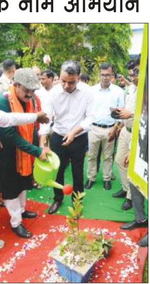
अधिक पेड़ लगाने का आह्वान किया गया।