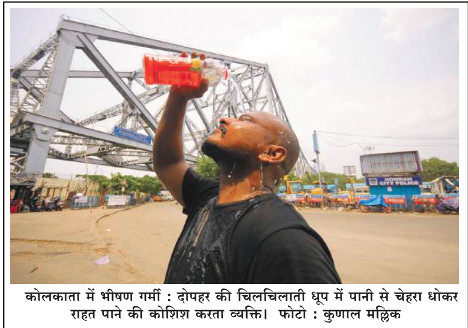
कोलकाता में भीषण गर्मी : दोपहर की चिलचिलाती धूप में पानी से चेहरा धोकर राहत पाने की कोशिश करता व्यक्ति।

आधुनिकीकरण, अंतर्देशीय जलमार्गों को मजबूत करना, जहाज विनिर्माण और मरम्मत के लिए बुनियादी ढांचे का निर्माण, क्रूज पर्यटन के लिए ढांचे का विकास, नदी किनारों का पुनर्विकास तथा बंदरगाहों से जुड़े औद्योगिक क्षेत्रों का विकास शामिल है। सोनोवाल ने कहा कि पश्चिम बंगाल भारत के समुद्री भविष्य के लिए बेहद महत्वपूर्ण है और लगभग 19,209 करोड़ रुपये के निवेश के जरिए कोलकाता और हल्दिया को पूर्वी भारत का प्रमुख समुद्री प्रवेश द्वार बनाया जाएगा।