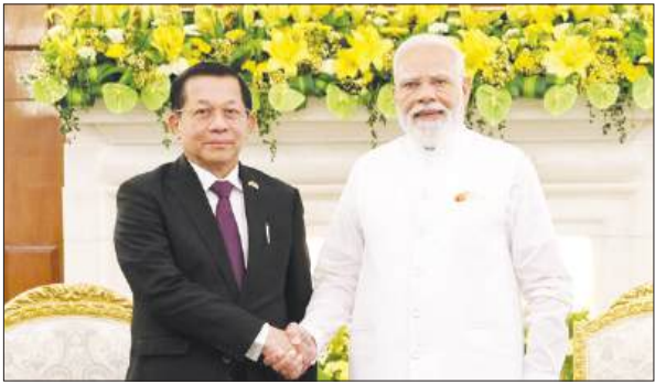
तख्तापलट कर आंग सान सू ची की लोकतांत्रिक रूप से चुनी गई सरकार को बेदखल कर दिया था। दोनों पक्षों ने कालान्ता मल्टी-मॉडल ट्रांजिट ट्रांसपोर्ट परियोजना और भारत-म्यांमा-थाईलैंड त्रिपक्षीय राजमार्ग

नयी दिल्ली : म्यांमा के राष्ट्रपति यू मिन आंग ह्वाइंग ने सोमवार को प्रधानमंत्री नरेन्द्र मोदी को आश्वासन दिया कि भारत के सुरक्षा हितों के खिलाफ उनके देश की धरती का इस्तेमाल नहीं होने दिया जाएगा। दोनों नेताओं ने व्यापार, रक्षा और ऊर्जा क्षेत्रों में द्विपक्षीय संबंधों को बढ़ावा देने के लिए व्यापक वार्ता की। आंग ह्वाइंग पांच दिवसीय भारत यात्रा पर हैं। म्यांमा में संसदीय चुनावों के बाद राष्ट्रपति बनने के दो महीने से भी कम समय में वह भारत यात्रा पर आए हैं। सत्ताधारी सैन्य जुंटा के खिलाफ वर्षों से जारी प्रदर्शनों के बाद ये चुनाव दिसंबर और जनवरी में कराए गए। सैन्य जुंटा ने एक फरवरी, 2021 को