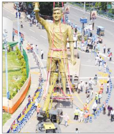
दी कि यह ढांचा खतरनाक स्थिति में है और इसके गिरने का खतरा है।

कोलकाता, समाज्ञा : अर्जेंटीना के दिग्गज फुटबॉल खिलाड़ी लियोनेल मेस्सी की 70 फुट ऊंची प्रतिमा को सोमवार को सुरक्षा कारणों से यहां लेक टाउन से हटा दिया गया। बता दें कि हालिया तूफानों के कारण प्रतिमा ढांचाकार रूप से अस्थिर हो गई थी। लोक निर्माण विभाग (पीडब्ल्यूडी) के अधिकारियों के अनुसार, प्रतिमा को बिना किसी नुकसान के उसके चबूतरों से अलग किया गया और एक 'हाइड्रोलिक क्रैन' की मदद से टुक पर रखा गया। यह प्रतिमा फिलहाल पीडब्ल्यूडी की निगरानी में रहेगी। इसे दोबारा कहां स्थापित किया जाएगा, इस बारे में अभी तक कोई आधिकारिक घोषणा नहीं की गई है। हालांकि, ऐसी अफवाह है कि राज्य सरकार के अंतिम फैसले के बाद इसे रवींद्र सरोवर या इको पार्क में लगाया जा सकता है।