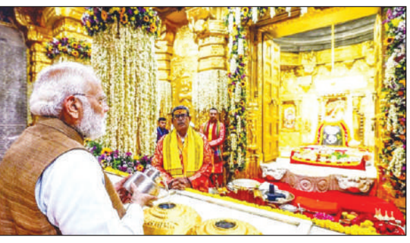
सोमनाथ मंदिर में की 'महा पूजा', एयरशो देखा

प्रधानमंत्री नरेन्द्र मोदी ने सोमवार को सोमनाथ मंदिर में 'महा पूजा' और अन्य अनुष्ठान किए। यह अनुष्ठान इस पुनर्निर्मित मंदिर के लोकार्पण की 75वीं वर्षगांठ के उपलक्ष्य में आयोजित सोमनाथ अमृत महोत्सव के अंतर्गत किया गया। प्रधानमंत्री ने यहां रोड शो करने के बाद भगवान शिव को समर्पित इस मंदिर में प्रवेश किया और वैदिक मंत्रोच्चार के बीच 'महा पूजा' करने के साथ ही शिवलिंग पर जलाभिषेक किया। मोदी ने कुंभाभिषेक भी देखा, जिसमें देश भर के प्रमुख तीर्थ स्थलों से एकत्रित पवित्र जल को क्रेन की सहायता से मंदिर के शिखर पर छिड़का गया। सोमनाथ अमृत महोत्सव का आयोजन 1951 में पुनर्निर्मित इस मंदिर का भारत के पहले राष्ट्रपति डॉ. राजेंद्र प्रसाद द्वारा लोकार्पण किए जाने की 75वीं वर्षगांठ के उपलक्ष्य में किया जा रहा है। प्रधानमंत्री, गुजरात के मुख्यमंत्री भूपेंद्र पटेल और उप मुख्यमंत्री हर्ष संधवी के साथ, भारतीय वायुसेना की सूर्यकिरण एरोबेटिक टीम (एसकेएटी) द्वारा मंदिर के ऊपर किए गए हवाई करतबों का अवलोकन किया।