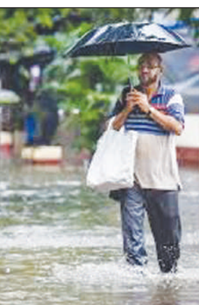
भुवनेश्वर: श्रीलंका के उत्तरी तट के पास दक्षिण-पश्चिम बंगाल की खाड़ी के ऊपर सोमवार को बना निम्न दाब क्षेत्र अगले 48 घंटे में गीर्ण तीव्र हो सकता है, जिसके चलते अगले छह दिनों तक ओडिशा के कई हिस्सों में हल्की से मध्यम बारिश होने की संभावना है। भारतीय मौसम विज्ञान विभाग (आईएमडी) ने यह जानकारी दी। आईएमडी ने

अपने सुबह की बुलेटिन में बताया कि यह प्रणाली मन्नार की खाड़ी और उससे सटे श्रीलंका के ऊपरी हवा के चक्रवाती परिचरचरण के प्रभाव से बनी है। उसने कहा, आज सुबह 5:30 बजे, उत्तरी श्रीलंका के तट से थोड़ी दूर, दक्षिण-पश्चिमी बंगाल की खाड़ी के ऊपर एक निम्न दाब क्षेत्र बन गया, जिससे जुड़ा चक्रवाती परिचरचरण समुद्र तल से 5.8 किलोमीटर की ऊंचाई तक फैल गया है। मौसम विभाग के अनुसार, अगले 48 घंटों में इस प्रणाली के और अधिक तीव्र होने की उम्मीद है। आईएमडी के भुवनेश्वर केंद्र के अनुसार, 21 जिलों में गरज चमक के साथ हल्की से मध्यम बारिश होने की संभावना है। मयूरभंज जिले के लिए 'अर्रिज अलर्ट' सहित 20 अन्य जिलों के लिए 'थेलो अलर्ट' जारी किया गया है।