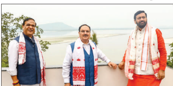
और नयी मंत्रिपरिषद के सदस्यों को पद और गोपनीयता की शपथ दिलाएंगे। भाजपा नीत गठबंधन के 2016 में तत्कालीन मुख्यमंत्री सर्वानंद सोनीवाल के नेतृत्व में पहली बार सत्ता में आने के बाद से यह राज्य में राजग का लगातार तीसरा कार्यकाल होगा। राजग में भाजपा, असम गण परिषद (अगप) और बोडोलैंड पीपुल्स फ्रंट (बीपीएफ) शामिल हैं। गठबंधन ने

गुवाहाटी: असम में मंगलवार को हिमंत विश्व शर्मा के लगातार दूसरी बार मुख्यमंत्री पद की शपथ लेने की तैयारी पूरी हो चुकी है। इसके साथ ही राज्य में भारतीय जनता पार्टी (भाजपा) नीत राष्ट्रीय जनतांत्रिक गठबंधन (राजग) सरकार का लगातार तीसरा कार्यकाल शुरू होगा। खानापारा के पशु चिकित्सा महाविद्यालय मैदान में होने वाले शपथ ग्रहण समारोह में प्रधानमंत्री नरेन्द्र मोदी, केंद्रीय गृह मंत्री अमित शाह, रक्षा मंत्री राजनाथ सिंह, वित्त मंत्री निर्मला सीतारमण, केंद्रीय मंत्री सर्वानंद सोनीवाल और भाजपा के राष्ट्रीय अध्यक्ष नितिन नवीन के साथ-साथ राजग शासित राज्यों के 40 से अधिक मुख्यमंत्रियों और उपमुख्यमंत्रियों के उपस्थित रहने की संभावना है। राज्यपाल लक्ष्मण प्रसाद आचार्य पूर्वाह्न 11 बजकर 40 मिनट पर शर्मा