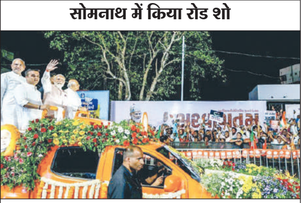
सोमनाथ में किया रोड शो

प्रधानमंत्री नरेन्द्र मोदी ने सोमनाथ अमृत महोत्सव में भाग लेने से पहले सोमवार को गुजरात के गिर सोमनाथ जिले में रोड शो किया। सोमनाथ अमृत महोत्सव, भगवान शिव के प्रसिद्ध मंदिर के जीर्णोद्धार किए जाने के बाद इसे श्रद्धालुओं के लिए फिर से खोले जाने के 75 वर्ष पूरे होने के उपलक्ष्य में आयोजित किया जा रहा है। हैलीपेड से प्रसिद्ध सोमनाथ मंदिर के पास वीर हमीरजी सकलत तक लगभग डेढ़ किलोमीटर लंबे मार्ग पर प्रधानमंत्री मोदी का स्वागत करने के लिए बड़ी संख्या में लोग कतार में खड़े थे। क्षेत्र से मोदी का काफिला गुजराते समय लोगों ने झंडे लहराए और नारे लगाए। पश्चिम बंगाल समेत देश के विभिन्न हिस्सों से आए कलाकारों ने मार्ग में निर्धारित स्थानों पर पारंपरिक नृत्य प्रस्तुत किए। प्रधानमंत्री अपने दो दिवसीय गुजरात दौरे के तहत रविवार रात जामनगर पहुंचे और रात्रि विश्राम के बाद सोमवार सुबह सोमनाथ पहुंचे। सोमनाथ मंदिर 12 ज्योतिर्लिंगों में से एक है और भारत की अटुट आस्था तथा सभ्यतागत विरासत का प्रतीक है।