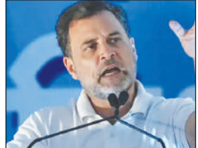
घंटे पहले व्हाट्सएप पर बिक रहे थे 22 लाख से ज्यादा बच्चे साल भर रात-रात भर आंखें जलाकर पढ़ते रहे और एक रात में उनका भविष्य बाजार में सरेआम नीलाम हो गया।' उन्होंने कहा, 'यह पहली बार नहीं है। 10 साल में 89 पेपर लीक, 48 बार दोबारा परीक्षा। हर बार वही कांड, और फिर वही खामोशी।' कांग्रेस नेता ने कहा, 'मोदी जी, जब आप अपनी हर नाकामी का बिल जनता पर डालते हैं, तो गरीब बच्चों का भविष्य भी उसी बिल में आता है। 22 लाख बच्चों का भरोसा टूटा है।' उन्होंने दावा किया कि मोदी सरकार से बड़ा खतरा भारत के युवाओं के सपनों के लिए कोई नहीं है।

नयी दिल्ली: कांग्रेस के पूर्व अध्यक्ष राहुल गांधी ने मेडिकल प्रवेश परीक्षा 'नीट-यूजी' में कथित अनियमितता को लेकर सोमवार को दावा किया कि नीट अब परीक्षा नहीं, बल्कि नीलामी बन चुकी है। उन्होंने यह भी कहा कि मोदी सरकार युवाओं के सपनों के लिए सबसे बड़ा खतरा है। राष्ट्रीय परीक्षा एजेंसी (एनटीई) ने कहा है कि नीट (स्नातक) 2026 का आयोजन पूर्ण सुरक्षा प्रोटोकॉल के तहत किया गया तथा कथित अनियमितताओं की समीक्षा एएसओजी (विशेष अभियान रजिस्टर) द्वारा की जा रही पड़ताल की खबरों के बीच वह जांच एजेंसियों के साथ मिलकर काम कर रही है। स्नातक स्तर पर चिकित्सा शिक्षा पाठ्यक्रमों में प्रवेश लेने के इच्छुक छात्रों के लिए राष्ट्रीय परीक्षा एजेंसी द्वारा तीन मई को राष्ट्रीय पात्रता-सह-प्रवेश परीक्षा (नीट) आयोजित की गई थी। राहुल गांधी ने 'एएस' पर पोस्ट किया, 'नीट 2026 के पेपर लीक की खबर सुनी। परीक्षा नहीं - नीट अब नीलामी है। कई सवाल परीक्षा से 42