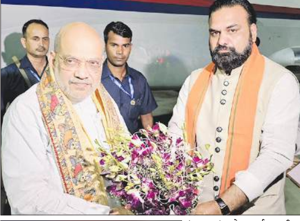
(भाजपा) के पूर्व राष्ट्रीय अध्यक्ष शाह का पटना हवाई अड्डे पर मुख्यमंत्री सम्राट चौधरी ने स्वागत किया। पिछले महीने सम्राट चौधरी बिहार में भाजपा की ओर से सरकार का नेतृत्व करने वाले पहले नेता बने थे। भाजपा के प्रमुख रणनीतिकार माने जाने वाले शाह हवाई अड्डे से सीधे शाह के एक होटल पहुंचे, जहां उन्होंने पार्टी और राष्ट्रीय जनतांत्रिक गठबंधन (राजग) के कई नेताओं से मुलाकात की। इसके बाद वह रात में वहीं ठहरे हैं। बृहस्पतिवार को होने वाले समारोह के लिए पटना मंत्रिमंडल के विस्तार समारोह में शामिल होंगे। यह समारोह बृहस्पतिवार को प्रधानमंत्री नरेन्द्र मोदी की मौजूदगी में आयोजित किया जाएगा। भारतीय जनता पार्टी