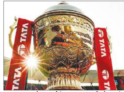
अहमदाबाद करेगा आईपीएल फाइनल की मेजबानी, धर्मशाला और न्यू चंडीगढ़ में होंगे प्लेऑफ मैच पृष्ठ 8

कोलकाता, ज्येष्ठ कृष्णपक्ष पंचमी, वि.स. 2082, पृष्ठ 8, मूल्य 3.00 रुपये