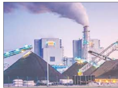
कोयला गैसीकरण परियोजनाओं के लिए 37,500 करोड़ रुपये की प्रोत्साहन योजना को जल्द मिल सकती है मंजूरी पृष्ठ 8

कोलकाता, ज्येष्ठ कृष्णपक्ष तृतीया, वि.स. 2082, पृष्ठ 8, मूल्य 3.00 रुपये