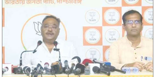
समाज्ञा, राज्य के सभी लोग, हमने सबसे यह अपील की है कि चुनाव के बाद होने वाली हिंसा के इतिहास को खत्म किया जाना चाहिए। इस संस्कृति को रोका जाना चाहिए। पूरा देश बदल चुका है। बिहार और उत्तर प्रदेश में चुनाव होते हैं, ऐसे हाई-वोल्टेज चुनाव, लेकिन वहां ऐसा नहीं होता। भट्टाचार्य ने इस बार के चुनाव को ऐतिहासिक बताया है और कहा कि आजादी के बाद राज्य में पहली बार इतना शांतिपूर्ण चुनाव हुआ है। फिर भी उन्होंने याद दिलाया कि भाजपा 'चुनाव के बाद हिंसा' की सबसे बड़ी शिकार रही है। उन्होंने आंकड़े देते हुए कहा कि

कोलकाता, समाज्ञा : भाजपा के प्रदेश अध्यक्ष समिक भट्टाचार्य ने रविवार को फलता में दोबारा मतदान और चुनाव के बाद होने वाली संभावित हिंसा को लेकर पार्टी की तैयारियों पर विस्तार से बात की। उन्होंने कहा कि तृणमूल कांग्रेस जो करना चाहती है करे, लेकिन चुनाव आयोग का फैसला अंतिम है। समिक भट्टाचार्य ने कहा कि टीएमसी एक राजनीतिक पार्टी है, वे भी कुछ न कुछ करेंगे, उन्हें करने दीजिए। चुनाव के बाद हिंसा के इतिहास को लेकर समिक भट्टाचार्य ने चिंता जताई और इसे समाप्त करने की अपील की। उन्होंने कहा कि भाजपा भाजपा पूरी तरह से तैयार है। हमारे पास कार्टिंग एजेंट होंगे, और न केवल हमारे कार्यकर्ता, बल्कि पूरा