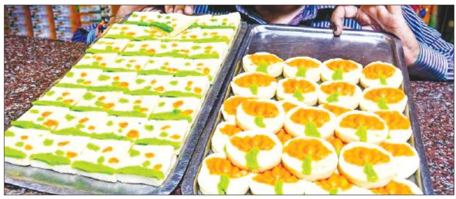
गुलाब-स्वाद वाली लाल मिठाई 'लाल सलाम' तक, कोलकाता के मिठाई विक्रेताओं ने भारी मात्रा में तैयार कर रखी है। कोलकाता के मिठाई दुकानदारों ने कहा कि सत्तारूढ़ दल और विपक्षी पार्टी के

कोलकाता, समाज्ञा : विधानसभा चुनाव को लेकर महीने भर से अधिक समय से भाजपा और तृणमूल कांग्रेस के बीच जारी सियासी घमासान में मछली, झालमुड़ी और क्षेत्रीय अम्मिता जैसे मुद्दों के जरिये मतदाताओं से संपर्क साधा गया। और अब, आज मतगणना के बाद विभिन्न पार्टियों के रंगों में रंगी मिठाइयों के साथ इस कड़वाहट भर चुनावी मुकाबले के संपन्न होने की उम्मीद है। भगवा रंग की 'मोदीश्री' और तृणमूल कांग्रेस के हरे रंग वाली 'जाँय बांग्ला' मिठाइयों से लेकर माक दलों के