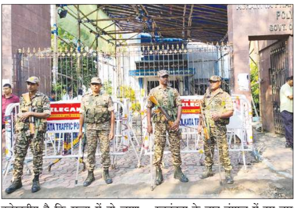
उल्लेखनीय है कि राज्य में दो चरण में हुआ चुनाव 29 अप्रैल को संपन्न हुआ। निर्वाचन आयोग के अनुसार, स्वतंत्रता के बाद बंगाल में इस बार सबसे अधिक 92.47 प्रतिशत मतदान दर्ज किया गया।

हो जाएंगी। ये तीनों दल 2021 के चुनाव में एक भी सीट नहीं जीत पाए थे, लिहाजा पांच साल के वनवास के बाद ये फिर से विधानसभा में अपनी वापसी की बात जोह रहे हैं। बता दें कि राज्य में 77 केंद्रों पर मतगणना होगी। कड़े सुरक्षा इंतजामों और गरमाए राजनीतिक माहौल के बीच 294 सदस्यों वाली विधानसभा की 293 सीट के परिणाम घोषित किए जाएंगे। भारत निर्वाचन आयोग ने दक्षिण 24 परगना जिले के फलता विधानसभा क्षेत्र में मतदान केंद्रों पर गडबडी का हवाला देते हुए चुनाव रद्द कर दिया। इस सीट पर 21 मई को दोबारा मतदान होगा जबकि मतगणना 24 मई को होगी।