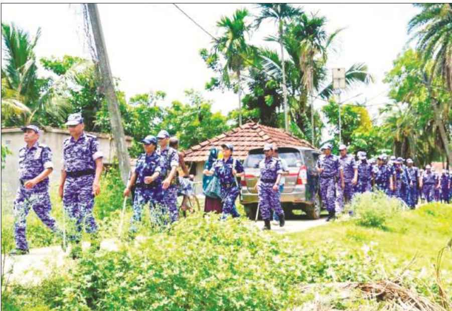
दक्षिण 24 परगना जिले के मगराहट पश्चिम विधानसभा क्षेत्र में पुनर्मतदान के दौरान सुरक्षा कड़ी रही, केंद्रीय बल के जवान लगातार गश्त करते दिखे