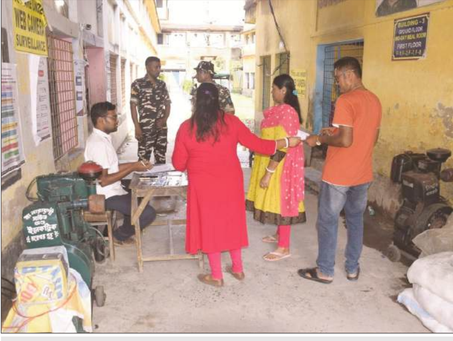
डायमंड हार्बर और मगराहट के 15 बूथों पर शांतिपूर्ण रूप से पुनर्मतदान हुआ संपन्न

जताई कि मतगणना के दिन भी किसी अप्रिय घटना की संभावना से इनकार नहीं किया जा सकता। मेचेदा के एक गेस्ट हाउस में आयोजित इस बैठक में अविभाजित मेदिनीपुर क्षेत्र की 35 विधानसभा सीटों के उम्मीदवार, एजेंट और भाजपा के कई नेता मौजूद थे। बैठक के बाद दिलीप घोष ने मतदान के बाद ही तृणमूल कांग्रेस को यह आभास हो गया था कि वह पीछे चल रही है, इसलिए दूसरे चरण में गड़बड़ी की कोशिश की गई। उन्होंने आशंका जताई कि मतगणना के दिन भी अशांति की स्थिति बन सकती है, क्योंकि हार स्वीकार करना कुछ लोगों के लिए कठिन हो सकता है।