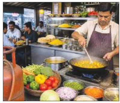
वाणिज्यिक एलपीजी महंगा: देशभर में खाने के दाम बढ़ने, रोजगार पर असर की आशंका पृष्ठ 8