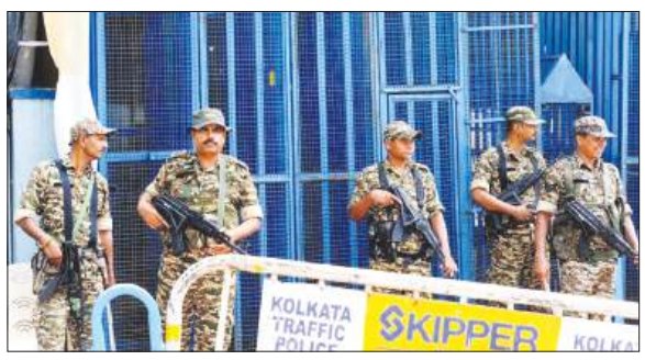
कोलकाता में ईवीएम स्ट्रॉंग रूम के बाहर कड़ी सुरक्षा व्यवस्था के बीच तैनात सुरक्षाकर्मी

कड़ी सुरक्षा के बीच कल 293 सीटों पर होगी मतगणना