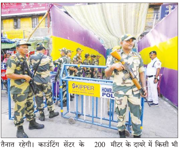
तैनात रहेगी। कार्टिंग सेंटर के 200 मीटर के दायरे में किसी भी

हावड़ा, समाज्ञा : राज्य के अन्य हिस्सों की तरह हावड़ा सदर में भी सोमवार, 4 मई को कड़ी सुरक्षा व्यवस्था के बीच तीन केंद्रों पर मतगणना कराई जाएगी। प्रशासन ने किसी भी प्रकार की अशांति से निपटने के लिए व्यापक इंतजाम किए हैं और संवेदनशील क्षेत्रों में बड़ी संख्या में केंद्रीय बलों की तैनाती की गई है। जिला प्रशासन के अनुसार, सभी मतगणना केंद्रों पर त्रिस्तरीय सुरक्षा व्यवस्था लागू रहेगी। पहले स्तर पर कार्टिंग सेंटर के 100 मीटर के दायरे में एकजीव्यूटिव मजिस्ट्रेट और राज्य पुलिस के अधिकारी मौजूद रहेंगे। दूसरे स्तर पर स्टेट