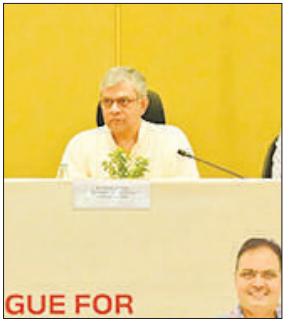
आधारशिला रखी गई है, जबकि पिछले एक वर्ष में इलेक्ट्रॉनिक उपकरण विनिर्माण योजना (ईसीएएस) के तहत 75 कारखानों को मंजूरी दी गई है। वैष्णव ने मुख्यमंत्री भजनलाल शर्मा के साथ

जयपुर : केंद्र और राजस्थान सरकार ने प्रोत्साहन, नीतिगत समर्थन एवं बुनियादी ढांचे पर जोर देते हुए शनिवार को राज्य को इलेक्ट्रॉनिक्स एवं सेमीकंडक्टर विनिर्माण के एक प्रमुख गंतव्य के रूप में पेश किया और निवेशकों से इकाइयां स्थापित करने का आग्रह करते हुए पूर्ण सहयोग का आश्वासन दिया। केंद्रीय इलेक्ट्रॉनिक्स एवं सूचना प्रौद्योगिकी मंत्री अश्विनी वैष्णव ने कहा कि राजस्थान में इस क्षेत्र में 'अपार संभावनाएं' हैं और प्रधानमंत्री नरेन्द्र मोदी की अगुवाई में इलेक्ट्रॉनिक्स विनिर्माण ने तीव्र वृद्धि दर्ज की है। उन्होंने कहा कि पिछले दो वर्षों में करीब 450 कारखानों की