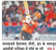
सनाइजर्स हैदराबाद जौनी, हार के बावजूद आसवीबी तालिका में शीर्ष पर रही पृष्ठ 8

स्थानीय छात्रों के पृष्ठ तीन, चार और पांच पर