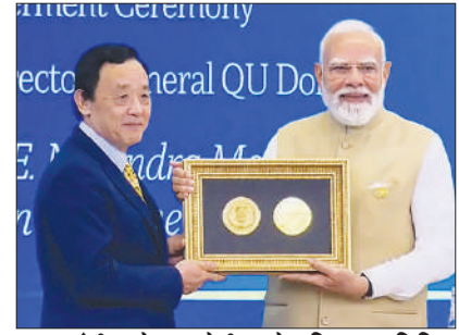
प्रधानमंत्री नरेन्द्र मोदी को मिला प्रतिष्ठित 'एफओ एपीकोला' पदक

सुविचार : लोग दाग खोजने लगे तो समझिये कि आपकी चमक उससे बर्दास्त नहीं।