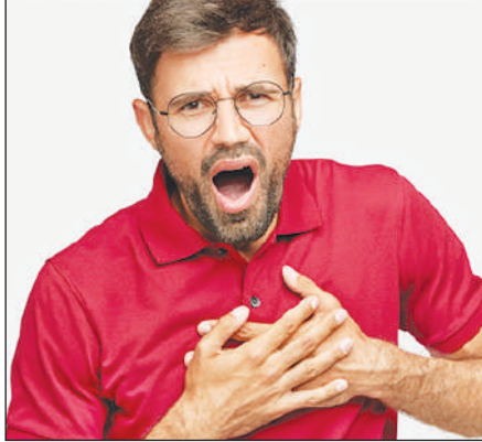
सेवन करें। हर नए साल पर कुछ निश्चय करें कि आप क्या आप्त करेंगे अपनी सेहत के लिए और क्या छोड़ेंगे।