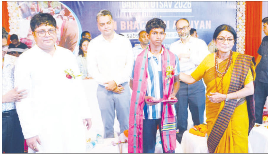
दक्षिण 24 परगना के सोनारपुर ब्लॉक में भारत सरकार के 'जन आगीदारी अभियान' के तहत 'जनजातीय गरिमा उत्सव' मनाया गया। इस अवसर पर जनजातीय नृत्य, संगीत, सामुदायिक प्रतिनिधियों का सम्मान, जाति प्रमाण पत्रों का वितरण और वृक्षारोपण जैसे कार्यक्रम आयोजित किए गए।