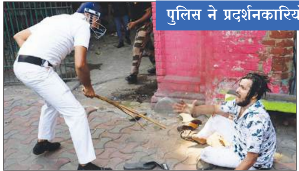
पुलिस ने प्रदर्शनकारियों पर किया लाठीचार्ज

पथराव में तीन पुलिस कर्मी घायल, कई वाहनों में तोड़फोड़