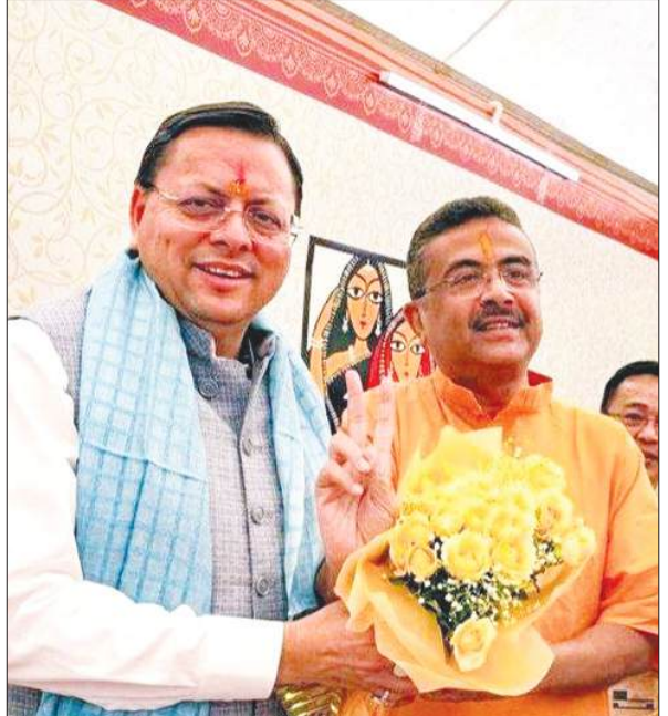
शपथ ग्रहण के बाद सीएम शुभेंदु अधिकारी को बधाई देते उत्तराखंड के सीएम पुष्कर सिंह धामी