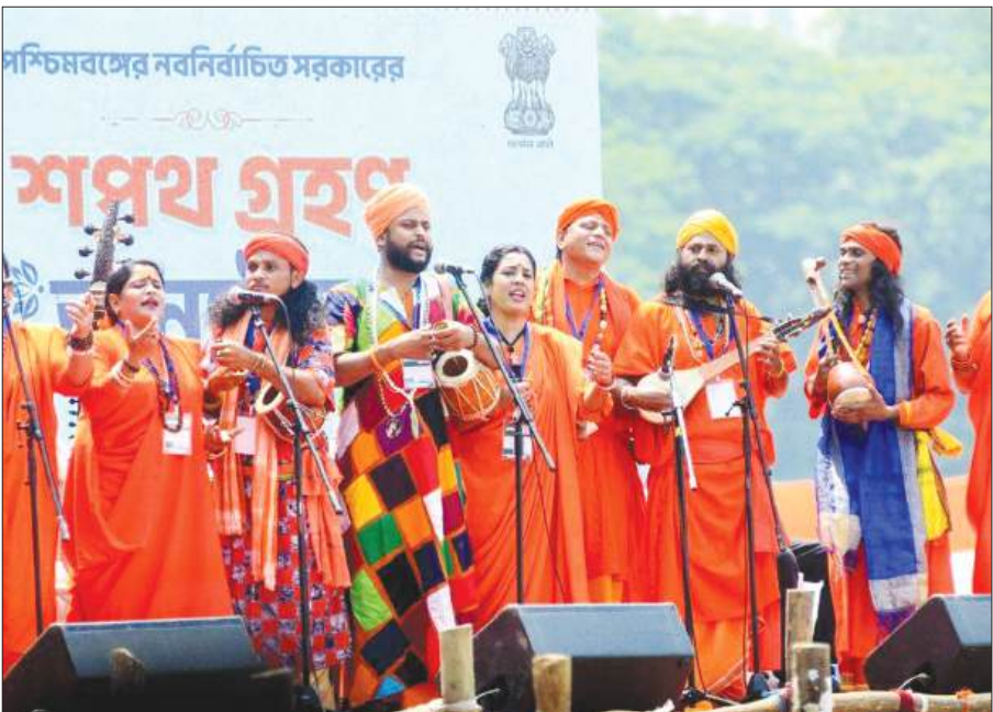
शपथ ग्रहण समारोह में लोक गान की प्रस्तुति देते बाउल गायक