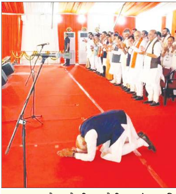
शपथ ग्रहण से पहले पीएम मोदी का बंगाल की जनता को प्रणाम