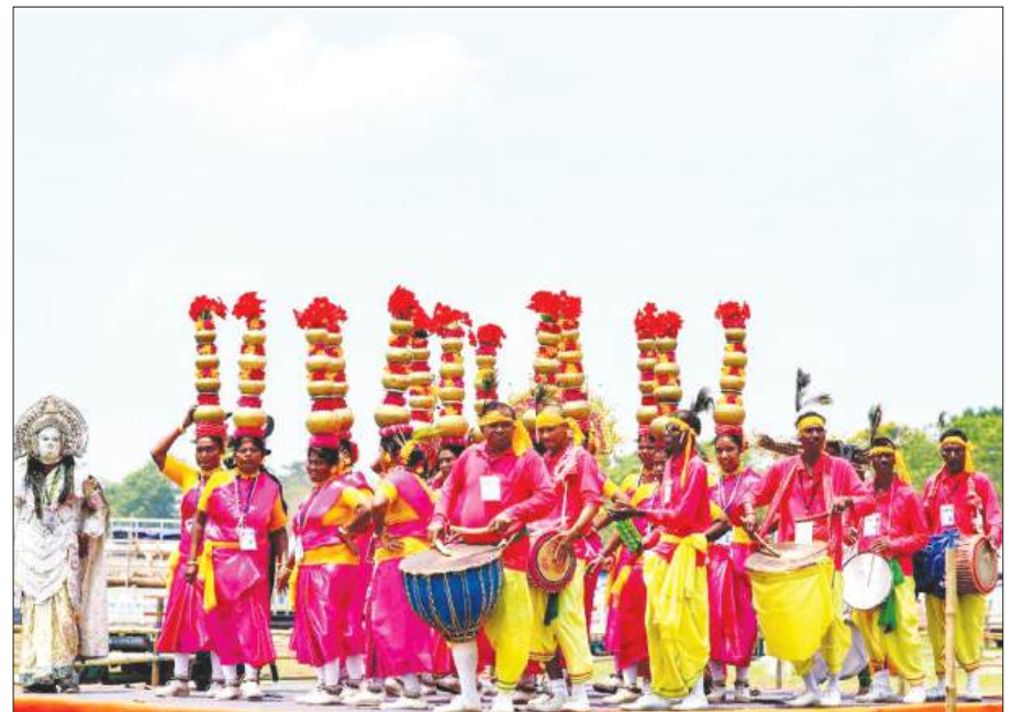
शपथ ग्रहण समारोह में सांस्कृतिक नृत्य पेश करती नृत्यांगना