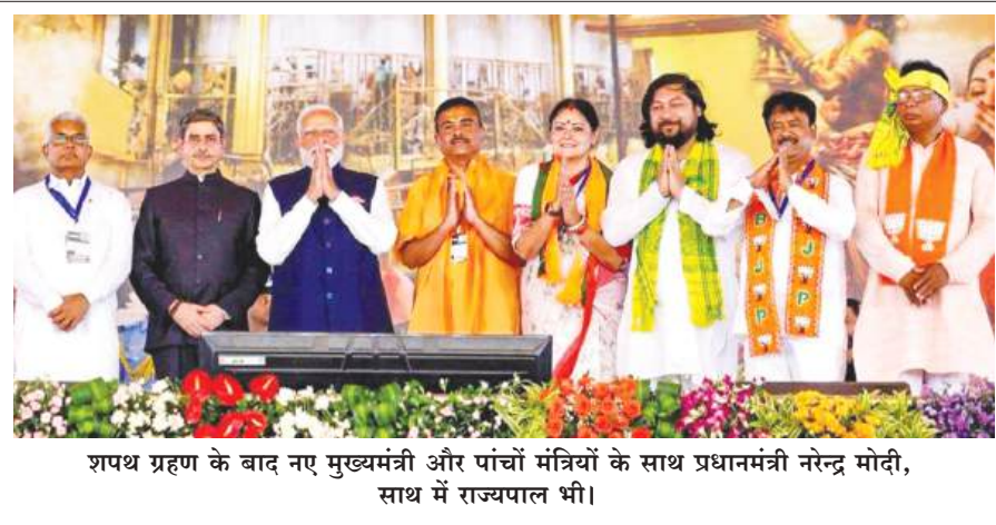
शपथ ग्रहण के बाद नए मुख्यमंत्री और पांचों मंत्रियों के साथ प्रधानमंत्री नरेन्द्र मोदी, साथ में राज्यपाल भी।