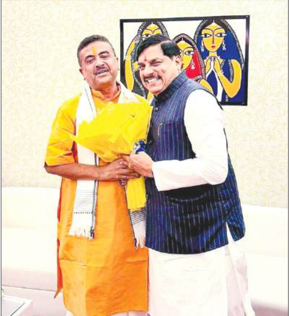
शपथ ग्रहण के बाद सीएम शुभेंदु अधिकारी को बधाई देते मध्य प्रदेश के सीएम मोहन यादव

हस्तिनां शनिवार को ब्रिगेड परेड ग्राउंड में उपस्थित रहीं। दिग्गज अभिनेता प्रसन्नजीत चटर्जी समारोह में सफेद कमीज पहने नजर आए। अभिनेता जीत सुबह जल्दी ही कार्यक्रम स्थल पर पहुंच गए। राजनीतिक कार्यक्रमों से आमतौर पर दूर रहने वाले जीत की उपस्थिति ने सबका ध्यान आकर्षित किया। अभिनेता जिस्सू सेनगुप्ता भी समारोह में हल्के भूरे रंग की कमीज और काला चरमा पहने नजर आए। अन्य उपस्थित लोगों में प्रसिद्ध शास्त्रीय गायक पंडित अजय चक्रवर्ती और नृत्यांगना ममता शंकर शामिल थीं। अभिनेता ऋषि कौशिक भी बंगाली टेलीविजन उद्योग के कई कलाकारों के साथ उपस्थित थे।