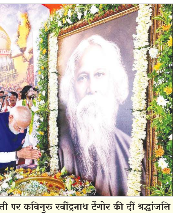
पीएम मोदी ने रविंद्र जयंती पर कविवरु रवींद्रनाथ टैगोर की दी श्रद्धांजलि

जोड़ते हुए बंगाल की जनता को नमन किया। उस समय शुभेंदु अधिकारी और नई कैबिनेट के सदस्य भी मंच पर मौजूद थे। प्रधानमंत्री के इस भावुक अंदाज पर मैदान में मौजूद समर्थकों ने जोरदार स्वागत किया। बाद में, प्रधानमंत्री मोदी ने एक्स पर इस पल का वीडियो साझा करते हुए लिखा कि वह पश्चिम बंगाल की जनशक्ति को नमन करते हैं। उन्होंने कहा कि जनता का आशीर्वाद लोकतंत्र की सबसे बड़ी ताकत और जनसेवा का सबसे बड़ा आधार है। भाजपा ने भी इस वीडियो को साझा करते हुए कहा कि यह दृश्य बंगाल की जनता के भरोसे और प्रधानमंत्री मोदी के नेतृत्व को समर्पित है।