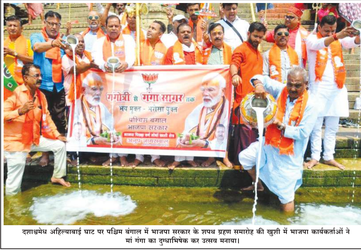
दशश्रमध अहिल्याबाई घाट पर पश्चिम बंगाल में भाजपा सरकार के शपथ ग्रहण समारोह की खुशी में भाजपा कार्यकर्ताओं ने मां गंगा का दुग्धाभिषेक कर उत्सव मनाया।

मीन : वी, वू, थ, झ, ज, दे, दो, चा, ची : मीन राशि के जातकों के लिए यह समाह शानदार रहेगा। आप स्वास्थ्य को लेकर संतुष्ट रहेंगे। व्यापार को लेकर भी आपके लिए समय अच्छा रहेगा। आपका व्यापार अच्छा चलेगा। नौकरी वाले जातकों के लिए समय अच्छा रहेगा। अपने कार्यक्षेत्र में उन्नति कर सकते हैं। आर्थिक स्थिति बढ़िया बनी रहेगी, धन की किसी प्रकार की कोई कमी नहीं रहेगी। खर्चें लगे रहेंगे, परंतु आमदनी भी अच्छी रहेगी। प्रेम संबंधों को लेकर थोड़ा सावधान रहना होगा। अहम के चलते विवाद हो सकता है। गृहस्थ जीवन बढ़िया रहेगा।