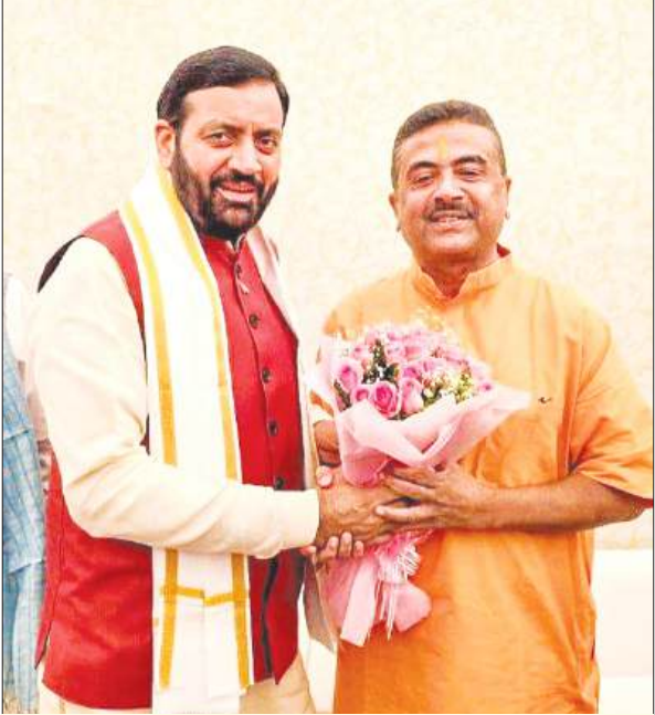
शपथ ग्रहण के बाद सीएम शुभेंदु अधिकारी को बधाई देते हरियाणा के सीएम नाया सिंह सैनी

कोलकाता, समाज : राज्य में भाजपा की पहली सरकार के शपथ ग्रहण समारोह का साक्षी बनने के लिए उत्तर बंगाल के अलावा झारखंड जैसे पड़ोसी राज्यों सहित देश-विदेश से भाजपा के हजारों समर्थक शनिवार को कोलकाता पहुंचे, जिससे ब्रिगेड परेड मैदान भगवा रंग में रंग गया। भाजपा के झंडे और भगवा बैनर लिए समर्थकों के समूह सुबह से ही शहर के विभिन्न स्थानों पर एकत्र हुए और फिर 'जय श्री राम' के नारों एवं प्रधानमंत्री नरेन्द्र मोदी एवं शुभेंदु अधिकारी के समर्थन में लगाए जा रहे नारों के बीच कार्यक्रम स्थल की ओर बढ़े। विशाल ब्रिगेड परेड मैदान में उत्सव जैसा माहौल दिखाई दिया। लोक