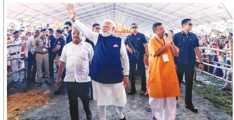
शपथ ग्रहण समारोह में शामिल होने के लिए कोलकाता के ब्रिगेड परेड मैदान में पहुंचने पर हाथ हिलाकर लोगों का अभिवादन करते प्रधानमंत्री नरेन्द्र मोदी, साथ में शुभेंदु अधिकारी एवं शमीक भट्टाचार्य

'अब बंगाल का होगा पुनर्निर्माण', सीएम पद की शपथ लेते ही शुभेंदु अधिकारी का ऐलान