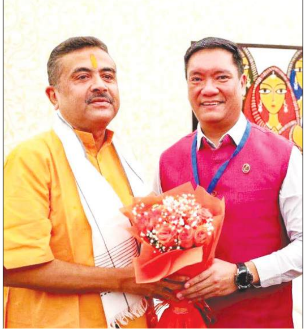
शपथ ग्रहण के बाद सीएम शुभेंदु अधिकारी को बधाई देते अरुणाचल प्रदेश के सीएम पेमा खांडू

इकाई ने मध्य कोलकाता के विशाल ब्रिगेड परेड ग्राउंड इलाके में झालमुड़ी के 20 स्टॉल लगाए, जबकि कई स्वतंत्र विक्रेता भी आयोजन स्थल के पास अच्छा कारोबार करते हुए देखे गए। शपथ ग्रहण समारोह में शामिल होने आए सैकड़ों लोग मुरपुरे, हरी मिर्च और तरह-तरह के मसालों से बने इस स्वादिष्ट नाश्ते का स्वाद लेने के लिए स्टॉल पर उमड़ पड़े।