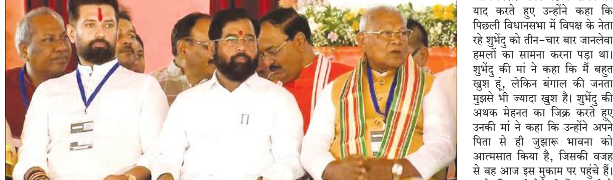
शुभेंदु अधिकारी के शपथ ग्रहण समारोह में केंद्रीय मंत्री चिराग पासवान, महाराष्ट्र की डिप्टी सीएम एकनाथ शिंदे, मंत्री जीतन राम मांझी, मंत्री केशव प्रसाद मोर्चें व अन्य वरिष्ठ नेता रहे उपस्थित

शुभेंदु अधिकारी के शपथ ग्रहण समारोह में यूपी के सीएम योगी आदित्यनाथ समेत अन्य वरिष्ठ नेता रहे उपस्थित