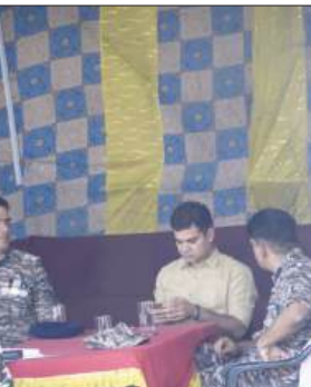
साथ बंगाल चुनाव के दूसरे चरण के दौरान डायमंड हार्बर में एडहॉक 343 की बी/4 कंपनी का दौरा किया।