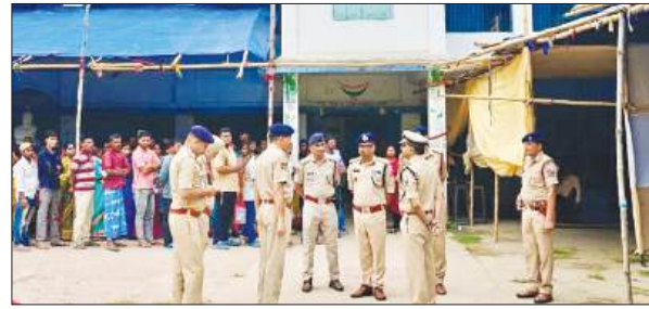
मुख्य सुरक्षा आयुक्त/पूर्व रेलवे, अमिय नंदन सिन्हा ने विभिन्न मतदान केंद्रों का दौरा कर सुरक्षा व्यवस्था का जायजा लिया। उन्होंने जमीनी स्तर पर तैनात कर्मियों से संवाद कर उनका उत्साहवर्धन किया और आवश्यक दिशा-निर्देश दिए। पूर्व रेलवे द्वारा पूरे क्षेत्र में आरपीएफ एवं आरपीएसएफ की

कोलकाता, समाज्ञा : पूर्व रेलवे के आरपीएफ के जवानों ने भीषण गर्मी के बीच मतदान प्रक्रिया को सुरक्षित और शांतिपूर्ण बनाए रखने में महत्वपूर्ण भूमिका निभाई। डायमंड हार्बर क्षेत्र में तैनात महिला एवं पुरुष कर्मी पूरे दिन मुसैदी के साथ ड्यूटी निभाते हुए लोकतांत्रिक प्रक्रिया की रक्षा में जुटे रहे। मतदान केंद्रों पर सुरक्षा व्यवस्था सुदृढ़ बनाए रखने के साथ-साथ आरपीएफ कर्मियों ने मतदाताओं, विशेषकर बुजुर्गों की सहायता कर उन्हें निर्भय होकर मतदान करने में सहयोग दिया। उनकी तत्परता और मानवीय दृष्टिकोण ने मतदान प्रक्रिया को सहज और सुव्यवस्थित बनाए रखने में अहम योगदान दिया। इस दौरान आईजी-सह-प्रधान