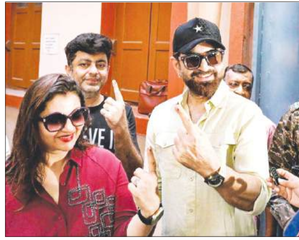
आकर अपने पिता के साथ मतदान किया, जिससे मुझे अपने पहले मतदान के दिनों की याद आ गई। बांग्ला फिल्मों के प्रसिद्ध अभिनेता और