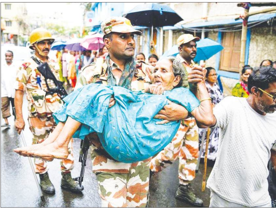
बुधवार को मतदान केंद्र पहुंची एक बुजुर्ग मतदाता को सुरक्षाकर्मी ने मतदान के लिए सहायता प्रदान की।