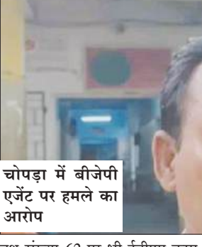
चोपड़ा में बीजेपी एजेंट पर हमले का आरोप

कोलकाता, समाज्ञा : विधानसभा चुनाव के दूसरे चरण में नदिया जिले में मतदान शुरू होने के बाद कई जगहों से ईवीएम खराब होने और हिंसा की खबरें सामने आई हैं। सुबह से ही जिले के विभिन्न बूथों पर मतदान प्रक्रिया प्रभावित हुई, जिससे मतदाताओं को परेशानी का सामना करना पड़ा। राणाघाट उत्तर पश्चिम विधानसभा क्षेत्र में राणाघाट नगरपालिका के 3 नंबर वार्ड स्थित बूथ संख्या 148 पर ईवीएम मशीन खराब हो जाने के कारण मतदान बाधित हो गया। सुबह से वोट डालने पहुंचे मतदाताओं को लंबा इंतजार करना पड़ा। वहीं, कृष्णानगर विधानसभा क्षेत्र के नकशीपाड़ा के धनजयपुर स्थित बूथ संख्या 236 पर भी ईवीएम मशीन में खराबी आने से मतदान प्रभावित हुआ। कालीगंज विधानसभा क्षेत्र के बाराचंदर के