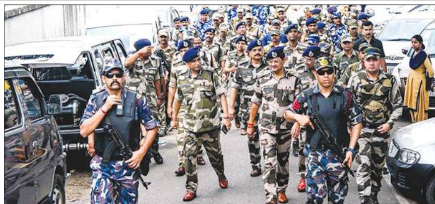
केंद्रीय बल अलर्ट

Phone: 033 2479 3089. E-mail: timberply@hotmail.com