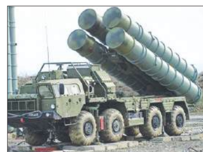
भारत को एस-400 मिसाइल प्रणाली की चौथी इकाई अगले महीने की शुरुआत में प्राप्त होने की उम्मीद पृष्ठ 11

कोलकाता, वैशाख शुक्लपक्ष त्रयोदशी, वि.स. 2082, पृष्ठ 12, मूल्य 3.00 रुपये सुविचार : सच बोलनेवाले की ताकत रखनेवाले अकेले चलना भी जानते हैं।