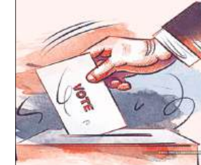
इस घटना को लेकर पोलिंग अधिकारियों में असंतोष और निराशा देखी जा रही है। उनका कहना है कि वे हजारों मतदाताओं को मतदान कराने की जिम्मेदारी निभाने जा रहे हैं, लेकिन स्वयं अपने मताधिकार का प्रयोग नहीं कर पाना बेहद दुखद है। अधिकारियों ने प्रशासन से जल्द समाधान की मांग की है, ताकि वे भी लोकतांत्रिक प्रक्रिया में अपनी भागीदारी सुनिश्चित कर सकें।

हावड़ा, समाज्ञा : पश्चिम बंगाल में दूसरे चरण के मतदान से पहले हावड़ा से एक चिंताजनक स्थिति सामने आई है, जहां कई पोलिंग अधिकारी अपने मताधिकार का उपयोग नहीं कर पाने को लेकर नाराजगी जता रहे हैं। पोलिंग अधिकारियों के अनुसार, उन्होंने हावड़ा के शरत सदन में प्रशिक्षण प्राप्त किया था, लेकिन अब तक उन्हें पोस्टल बैलेट के माध्यम से मतदान करने का अवसर नहीं मिला। उनका आरोप है कि जब वे पोस्टल बैलेट मतदान केंद्र पर पहुंचे, तो सूची में उनका नाम ही दर्ज नहीं था। इस संबंध में जिला प्रशासन से संपर्क करने पर हावड़ा के जिला शासक ने आश्वासन दिया है कि संबंधित कर्मचारियों के लिए मतदान की व्यवस्था की जा रही है। हालांकि,