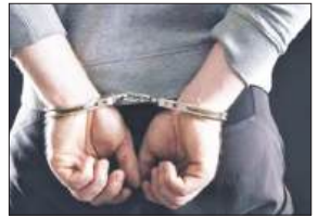
पूर्व बर्दवान में सबसे अधिक 479 लोगों को हिरासत में लिया गया/गिरफ्तार किया गया, उसके बाद उत्तर 24 परगना में 319 लोगों को हिरासत में लिया गया। दक्षिण 24 परगना में 246 लोगों को पकड़ा गया, जबकि हुगली में 49 और नदिया में 32 लोगों को पकड़ा गया। रविवार से सोमवार तक, आयोग ने इसी तरह विभिन्न जिलों में 1,095 'संभावित उपद्रवियों' को पकड़ा, लेकिन कोई विशिष्ट विवरण या सटीक स्थान नहीं बताया।

कोलकाता, समाज्ञा : चुनाव के दूसरे चरण से पहले गहरे निगरानी अभियान के तहत पिछले ढाई दिनों में कुल 2,473 लोगों को हिरासत में लिया गया है। निर्वाचन आयोग के अधिकारियों ने मंगलवार को यह जानकारी दी। निर्वाचन आयोग के एक अधिकारी के अनुसार, आज मतदान वाले कई जिलों में 'ढाई दिनों' के भीतर लोगों को पकड़ा (गिरफ्तारियां/हिरासत) में लिया गया है। आयोग के अधिकारी ने बताया कि सोमवार की रात को राज्य भर में 809 लोगों को हिरासत में लिया गया, जबकि मंगलवार तक यह संख्या बढ़कर 2,473 हो गई। हिरासत में लिए गए अधिकतर लोगों की पहचान संभावित उपद्रवी के रूप में की गई। सोमवार की रात आयोग द्वारा जारी आंकड़ों से पता चला कि