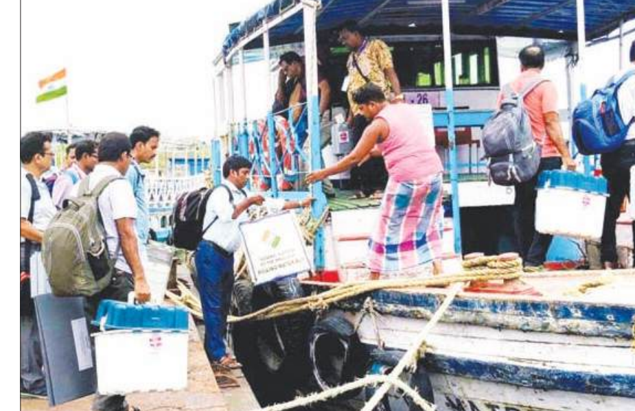
आज दक्षिण 24 परगना जिले में दूसरे और अंतिम चरण के मतदान से पहले, मतदान अधिकारी इलेक्ट्रॉनिक वोटिंग मशीन (ईवीएम) और अन्य चुनावी सामग्री लेकर अपने-अपने मतदान केंद्रों के लिए रवाना होते हुए।