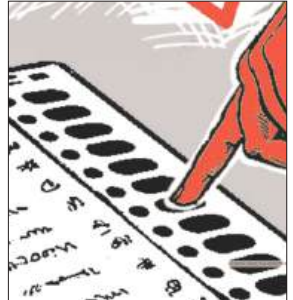
सबसे बड़े जिले - 33 सीट वाला उत्तर 24 परगना और 31 सीट वाला दक्षिण 24 परगना - एक बार फिर बंगाल के चुनाव जीतने की कुंजी साबित होंगे। कोलकाता की 11 सीट

कोलकाता : पश्चिम बंगाल में उत्तरी हिस्से की पहाड़ियों या जंगलमहल के वनक्षेत्र की तुलना में दक्षिणी बंगाल के घनी आबादी वाले मैदानी इलाकों की भूमिका सरकार बनाने में अधिक महत्वपूर्ण होती है। उत्तर और दक्षिण 24 परगना जिले इस चुनावी जंग में महत्वपूर्ण भूमिका निभाते हैं। यह दोनों जिले कोलकाता और हावड़ा के साथ तृणमूल कांग्रेस का सबसे मजबूत गढ़ है। भारतीय जनता पार्टी (भाजपा) इन्हें सत्ता हासिल करने का महत्वपूर्ण रास्ता मान रही है। भाजपा सत्तारूढ़ पार्टी के दक्षिणी गढ़ में सेंध लगाने की कोशिश कर रही है। यहां के दो