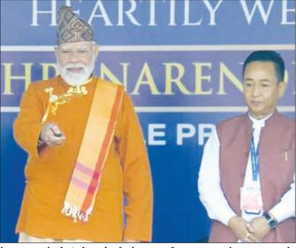
'एक्ट फास्ट' (तेजी से कार्रवाई) के लिए भी दृढ़ संकल्पित है। मोदी ने पूर्वोत्तर के इन आठ राज्यों को भारत की 'अष्टलक्ष्मी' बताया - जो

बागडोगरा से एक्सप्रेसवे और गंगटोक रिंग रोड निर्माण की घोषणा नाथुला एक्सप्रेसवे, रोपवे और स्काईवे परियोजनाएं भी विचाराधीन पूर्वोत्तर के आठ राज्यों को बताया देश की 'अष्टलक्ष्मी'