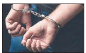
मुनाबिक, यह घटना आसनसोल के कुल्टी थाना के इलाके में हुई। रविवार की दोपहर दो नाबालिग लड़कियां आम तोड़ने के लिए बाहर गई थीं। सीआईएसएफ कैंप उस जगह के पास ही है जहां वे फल तोड़ रही थीं। आरोप है कि आरोपी जवान ने दोनों लड़कियों को और आम देने का वादा करने अपने कार्टर में बुलाया। फिर, उसने एक लड़की को बाहर इंतजार कराया और दूसरी को अपने कमरे में ले गया, जहां उसने उसके साथ छेड़छाड़ की। पीड़ित के परिवार का यह भी आरोप है कि जब

आसनसोल : आसनसोल के कुल्टी में एक नाबालिग लड़की से छेड़छाड़ के आरोप में एक सीआईएसएफ जवान को गिरफ्तार किया गया है। आसनसोल कोर्ट ने उसे 14 दिनों की ज्यूडिशियल कस्टडी में भेज दिया है। उसके खिलाफ पोक्सो एक्ट के तहत केस दर्ज किया गया है। हालांकि, पुलिस ने पूछताछ के लिए उसकी हिरासत की मांग करते हुए कोई अर्जी दाखिल नहीं की। कुल्टी थाने के पुलिस अधिकारियों ने बताया कि नाबालिग से छेड़छाड़ के आरोप में गिरफ्तार सीआईएसएफ जवान कुल्टी के शीतलपुर कैंप में तैनात था। उसे कुछ छुट्टी के लिए तैनात नहीं किया गया था, बल्कि, वह ईसीएल मार्शिंग एरिया में सिक्योरिटी के लिए जिम्मेदार था। पुलिस सूत्रों के