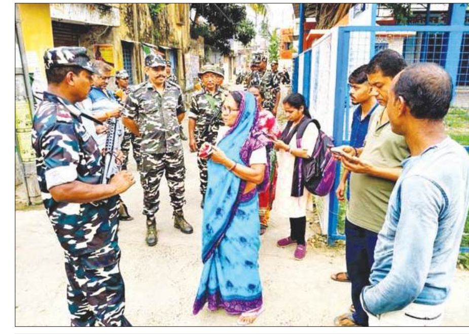
उत्तर 24 परगना जिले के हालीशहर इलाके में दूसरे चरण के मतदान से पहले एसएसबी के जवानों ने मतदाताओं का भरोसा जीतने के लिए उनसे बातचीत की।