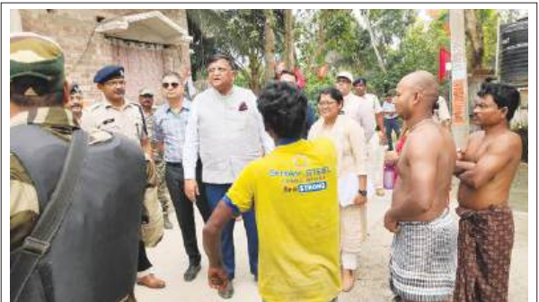
दूसरे चरण के मतदान से पहले पूर्व वर्धमान जिले में ग्रामीणों से बातचीत करते मुख्य निर्वाचन अधिकारी, जिला निर्वाचन अधिकारी और पुलिस अधीक्षक

कोलकाता, समाज्ञा : निर्वाचन आयोग ने विधानसभा चुनाव के दूसरे चरण के लिए रविवार को एक कड़ी सुरक्षा योजना पेश की, जिसमें यह स्पष्ट किया गया कि मतदान में विघ्न डालने या मतदाताओं को रोकने की किसी भी कोशिश के खिलाफ कठोर कदम उठाया जाएगा। आयोग ने सुरक्षा कर्मियों को निर्देश दिया कि वे निर्वाचन क्षेत्रों के अनुसार तैनाती करें और अंदरूनी सड़कों एवं संवेदनशील इलाकों में व्यवस्था बरकरार रखने के लिए कदम उठाएं, ताकि मतदाता निर्भय होकर अपने मतदान अधिकार का इस्तेमाल कर सकें। तीन जिलों के चुनाव अधिकारियों, वरिष्ठ पुलिस अधिकारियों और केंद्रीय बलों के कमांडरों की उपस्थिति में हुई एक बैठक में आयोग ने 29 अप्रैल को 142 निर्वाचन क्षेत्रों में होने वाले चुनाव की तैयारियों की समीक्षा की। अधिकारी ने कहा कि योजना के तहत, 160 मोटरसाइकिलों पर दो-