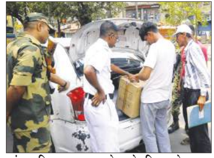
बंगाल विधानसभा चुनाव से पहले रविवार को सुरक्षा कर्मी वाहनों और लोगों की जांच करते हुए।

सुविचार : समय, विश्वास और सम्मान चले जाने के बाद वापस नहीं आते।