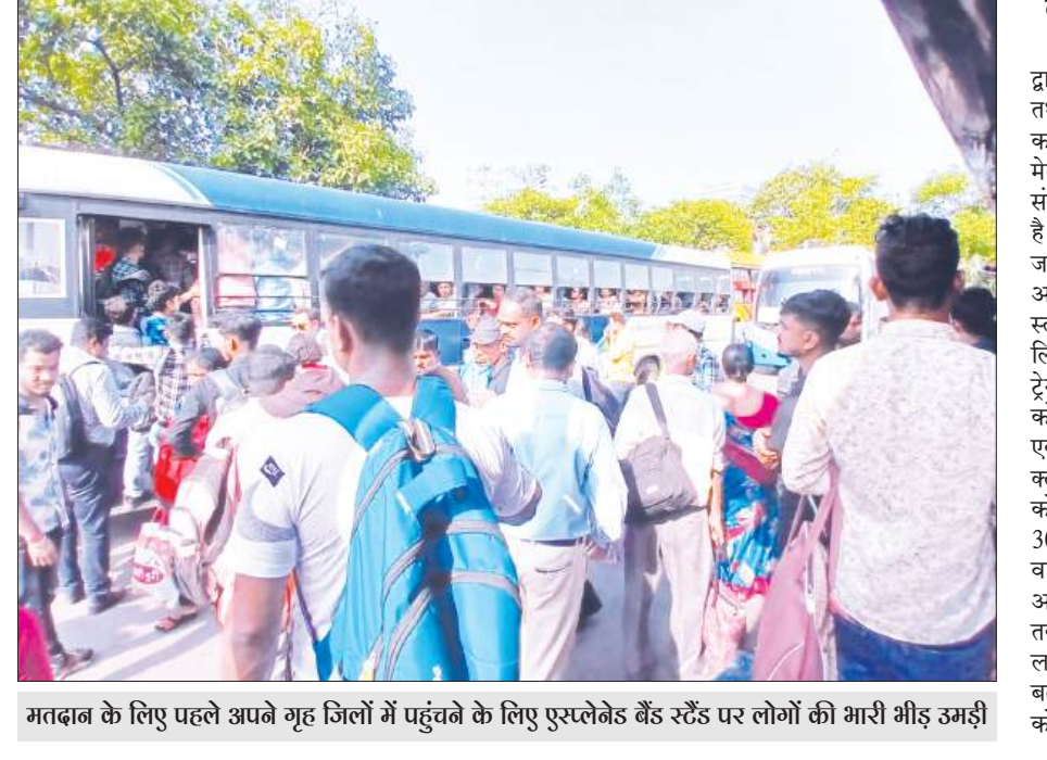
मतदान के लिए पहले अपने गृह जिलों में पहुंचने के लिए एरलेजेब बैंड रैड्स पर लोगों की भारी भीड़ उमड़ी