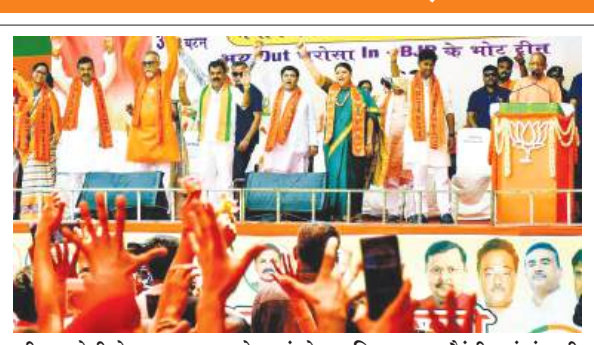
सीएम योगी ने श्यामपुर, जोड़ासांको, मानिकलता, चौरंगी एवं इंडाली विधानसभा क्षेत्रों के उम्मीदवारों के समर्थन में किया चुनाव प्रचार

कहा... 'बंगाल की पहचान काबा से नहीं, मां कालीबाड़ी से है'