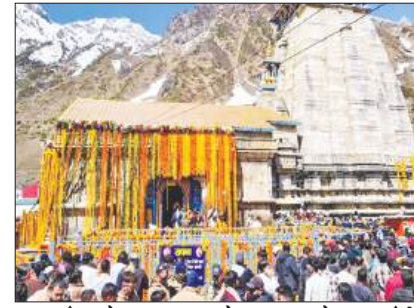
उत्तराखंड: केदारनाथ धाम के कपाट खुले, मुख्यमंत्री धामी भी हुए शामिल पृष्ठ 9

कोलकाता, वैशाख शुक्लपक्ष सप्तमी, वि.स. 2082, पृष्ठ 12, मूल्य 3.00 रुपये सुविचार: असंभव को संभव बनाने के लिए हमेशा कोशिश करना पड़ता है।