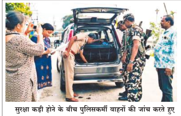
सुरक्षा कड़ी होने के बीच पुलिसकर्मियों वाहनों की जांच करते हुए

3.60 करोड़ से अधिक मतदाता 152 सीटों पर करेंगे मतदान, केंद्रीय बलों की 2,450 कंपनियों की तैनाती 8,000 से अधिक मतदान केंद्र 'अत्यधिक संवेदनशील' चिह्नित