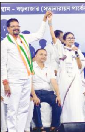
काम प्रयोग करें जिससे अग्रिकांड जैसी समस्या न हो। मुख्यमंत्री ने कहा कि यदि पुराना मकान नया बनाना चाहते हैं तो केएमसी आपको साथ में है। मुख्यमंत्री ने मंच से नोटबंदी जीएसटी का भी जिक्र किया। मुख्यमंत्री ने पीएम और गृह मंत्री पर हमला बोलते हुए कहा कि इनके