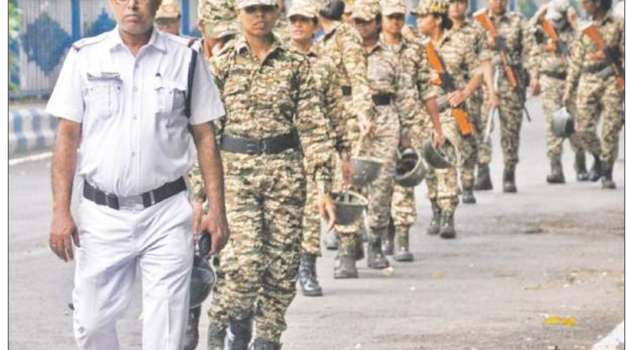
मतदान से पहले जादवपुर इलाके में स्थानीय पुलिस अधिकारी के साथ रूट मार्च करती महिला सीआरपीएफ

षणा की कि बेरोजगार युवाओं और महिलाओं को हर महीने 3,000 की सहायता दी जाएगी। इसके अलावा, राज्य में एक करोड़ रोजगार अवसर पैदा करने, प्रतियोगी परीक्षाओं की तैयारी के लिए 15,000 की आर्थिक सहायता देने और सभी खाली सरकारी पदों को पारदर्शिता के साथ भरने का वादा किया गया है। ठाकुर ने कहा कि बंगाल के युवा सिर्फ नौकरी पाने वाले नहीं, बल्कि नौकरी देने वाले भी बनेंगे। इसके साथ ही अंतरराष्ट्रीय स्तर का खेल प्रशिक्षण ढांचा विकसित करने की भी योजना है। अनुराग ठाकुर ने राज्य की आर्थिक स्थिति पर सवाल उठाते हुए कहा कि राज्य में बेरोजगारी दर लगभग 25 प्रतिशत तक पहुंच चुकी है, जो राष्ट्रीय औसत से कई गुना अधिक है। उन्होंने दावा किया कि राज्य में लाखों नौकरियां खत्म हो