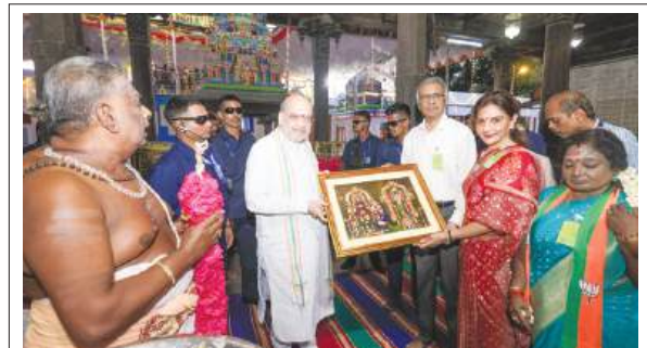
अमित शाह ने चेन्नई के अरुलमिगु कपालीश्वर मंदिर में पूजा-अर्चना की और देशवासियों के लिए सुख-समृद्धि व उत्तम स्वास्थ्य की कामना की