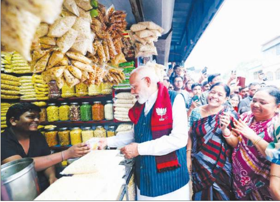
झाड़ग्राम में चुनावी दौरे के बीच सादगी की झलक-प्रधानमंत्री नरेन्द्र मोदी ने सड़क किनारे दुकान पर रुककर तरसा बंगाल का मशहूर सालमुड़ी, बच्चों के साथ साझा किया स्वाद और अपनाने।

लोग इतने साहसी हो गए हैं कि वे उनकी सभा में भी शामिल नहीं हो रहे। उन्होंने चेतावनी दी कि जो लोग पार्टी के लिए काम नहीं करेंगे या भाजपा की मदद करेंगे, उन्हें पार्टी से बाहर कर दिया जाएगा।