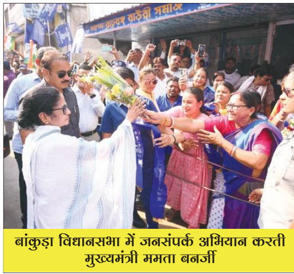
बांकुड़ा विधानसभा में जनसंपर्क अभियान करती मुख्यमंत्री ममता बनर्जी

रोजगार के मुद्दे पर ममता ने केंद्र सरकार से सवाल करते हुए कहा कि दो करोड़ नौकरियों का वादा कहां