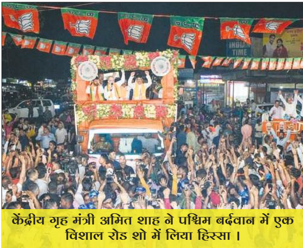
केंद्रीय गृह मंत्री अमित शाह ने पश्चिम बर्धमान में एक विशाल रोड शो में लिया हिस्सा।

पश्चिम बर्धमान जिले के रानीगंज में आयोजित जनसभा को संबोधित करते हुए शाह ने कहा कि पार्टी के संकल्प पत्र में महिलाओं और बेरोजगार युवाओं को 3,000 रुपये मासिक सहायता देने का वादा किया गया है। इस पर ममता बनर्जी द्वारा उठाए गए वित्तीय स्रोत के सवाल का जवाब देते हुए उन्होंने कहा कि राज्य में व्याप्त भ्रष्टाचार पर रोक लगाकर जो धन बसूला जाएगा, वही इन योजनाओं पर खर्च किया जाएगा। उन्होंने आरोप लगाया कि वर्तमान सरकार के दौरान सिंडिकेट राज चल रहा है और मवेशी तस्करी, कोयला