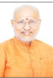
श्री पी. राधाकृष्णन भारत के उपराष्ट्रपति

मुझे अत्यंत हर्ष है कि मैं भारत और विश्वभर के सभी लोगों को बेसाखी, रोंगाली बिहू, महा बिषुबा पना संक्रांति, पोड़ला बोइशाख, विषु और तमिल पुथांडु के अवसर पर अपनी पारंपरिक नववर्ष की शुभकामनाएं देता हूँ, जो एक भारत श्रेष्ठ भारत की भावना को दर्शाते हैं। ये सभी शुभ अवसर सभी के जीवन में सुख, समृद्धि और खुशहाली लेकर आएंगे। चिथिरई का महीना कृषि की तैयारियों का समय होता है। किसान अपनी जमीन को उपजाऊ बनाने के लिए उस पर काम करना शुरू कर देते हैं। चूँकि हमारे लोग मानते हैं कि मेहनत से ही प्रगति होती है, इसलिए वे श्रम की शुरुआत का जश मनाते हैं। पूरे देश में, हमें इसी तरह के उत्सव देखने को मिलते हैं, जो भारत में एकता और साझा संस्कृति के उदाहरण हैं। उत्तर भारत में, विशेषकर पंजाब में, लोग बैसाखी को फसल उत्सव के रूप में मनाते हैं। दक्षिण में, केरल में विषु मनाया जाता है,