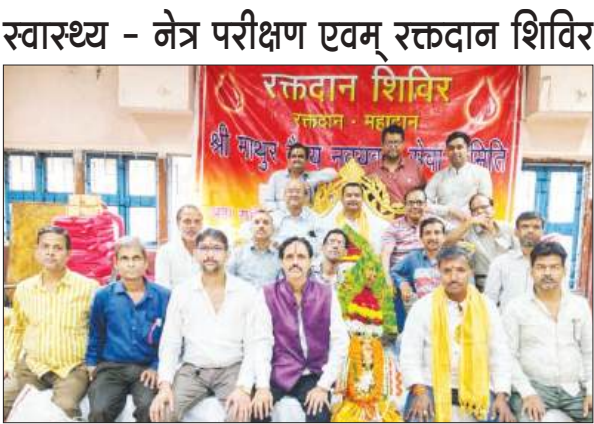
श्री माथुर वैश्य नवयुवक सेवा समिति का सेवा शिविर

स्वस्थ - नेत्र परीक्षण एवम् रक्तदान शिविर