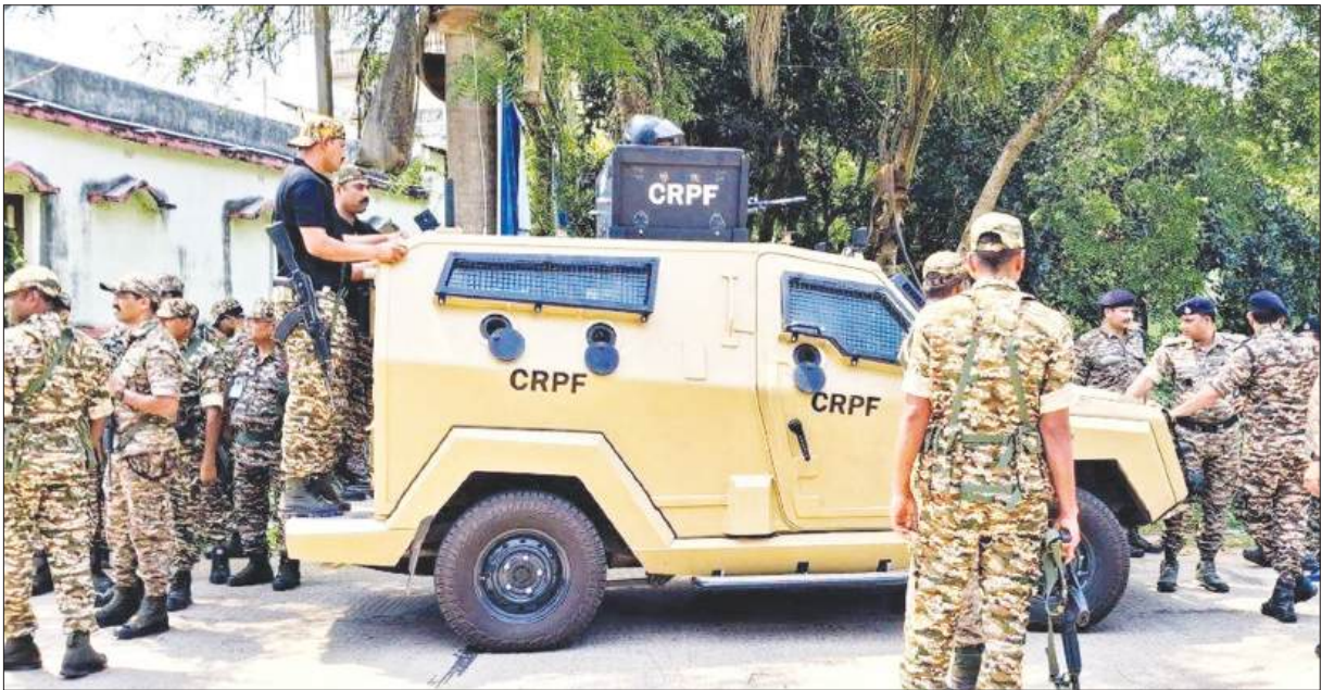
पश्चिम मेदिनीपुर जिले के केशपुर बाजार में पश्चिम बंगाल विधानसभा चुनाव से पहले सुरक्षा व्यवस्था के तहत बुलेटप्रूफ वाहनों में गश्त करते केंद्रीय रिजर्व पुलिस बल के जवान