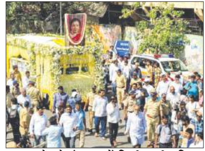
आशा भोसले पंचतत्व में विलीन, गीत फिजा में गुंजते रहेंगे पृष्ठ 7

मुविचार : कवि, लेखक और कलाकार यदि ज्ञान में टुटपुंजिए हों, तो उनकी कृतियों में गंभीरता नहीं आ सकती।