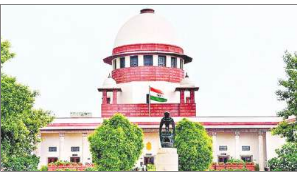
कोर्ट ने क्यों किया इनकार ?

नयी दिल्ली : बंगाल में मतदाता सूची से नाम कटने के मामले में सुप्रीम कोर्ट ने बड़ा फैसला सुनाया है। अदालत ने उन लाखों लोगों को अंतरिम राहत देने से इनकार कर दिया है, जिनका नाम स्पेशल इंटेंसिव रिव्यू के दौरान वोटर लिस्ट से हटा दिया गया था। इस फैसले से करीब 34 लाख से ज्यादा लोगों को बड़ा झटका लगा है, जो आगामी चुनाव में मतदान करने की उम्मीद कर रहे थे। मीडिया रिपोर्ट के अनुसार, कोर्ट को जानकारी दी गई कि 11 अप्रैल तक राज्य में कुल 34 लाख 35 हजार 174 अपीलें दायर की गई थीं। ये अपीलें उन लोगों की थीं, जिनके नाम मतदाता सूची से हटाए गए या खारिज कर दिए गए थे। याचिकाकर्ताओं ने कोर्ट से गुहार लगाई थी कि इन लोगों को बिना किसी विकल्प के नहीं छोड़ा जाना चाहिए, खासकर तब जब 23 अप्रैल को मतदान होने वाला है। उनका कहना था कि इतने बड़े स्तर पर मतदाताओं को वोट देने से रोकना लोकतांत्रिक अधिकारों के खिलाफ है।