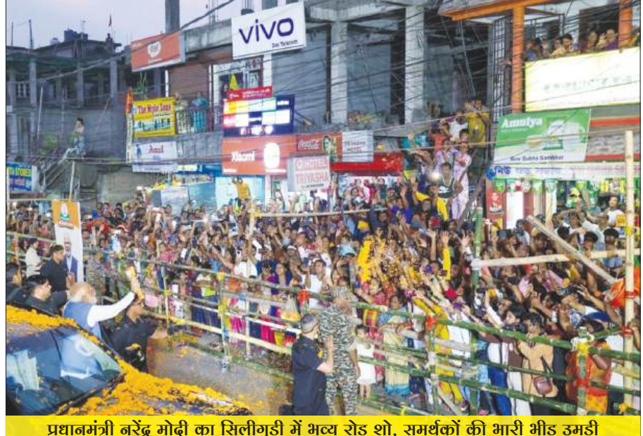
प्रधानमंत्री नरेंद्र मोदी का शिलीगुड़ी में भव्य रोड शो, समर्थकों की भारी भीड़ उमड़ी

कुशमंडी : प्रधानमंत्री नरेन्द्र मोदी ने शनिवार को सत्तारूढ़ तुणमूल कांग्रेस (टीएमसी) पर तीखा हमला बोले हुए उस पर पश्चिम बंगाल को सिंडिकेट द्वारा संचालित राज्य में बदलने का आरोप लगाया और भाजपा के सत्ता में आने पर महिलाओं के खिलाफ अत्याचारों पर कार्रवाई का वादा किया। बांग्लादेश की सीमा से लगे दक्षिण दिनाजपुर जिले के कुशमंडी में एक रैली को संबोधित करते हुए मोदी ने पिछले दिसंबर में अर्जेंटीना के फुटबॉल दिग्गज लियोनेल मेस्सी की कोलकाता यात्रा के दौरान हुई गड़बड़ी का जिक्र करते हुए कहा कि टीएमसी ने फुटबॉल का खेल भी अपने गिरोहों को सौंप दिया है। उन्होंने कहा, पूरी दुनिया ने उन शर्मनाक तस्वीरों को देखा। टीएमसी ने फुटबॉल को भी अपने सिंडिकेट के हवाले कर दिया है। राज्य को अराजकता का पर्याय बताते हुए मोदी ने कहा, पश्चिम बंगाल में सिंडिकेट ही सरकार है और सरकार ही सिंडिकेट है। प्रधानमंत्री ने कहा कि 2026 के विधानसभा चुनाव