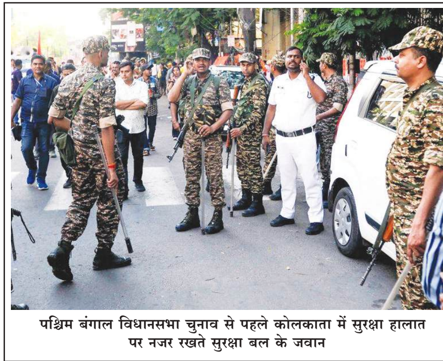
पश्चिम बंगाल विधानसभा चुनाव से पहले कोलकाता में सुरक्षा हालात पर नजर रखते सुरक्षा बल के जवान