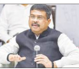
बंगाल के आंडा में एक जनसभा को संबोधित करते हुए केंद्रीय गृह मंत्री ने आलू किसानों के 'वास्तविक दर्द' को उजागर किया है। उन्होंने कहा कि ओडिशा और झारखंड जैसे पड़ोसी राज्यों के बाजार उनके लिए प्रभावी रूप से बंद हो गए हैं, जिससे उनकी कमाई प्रभावित हुई है। प्रधान ने कहा कि यह स्थिति तृणमूल कांग्रेस सरकार के किसान विरोधी रवैये को दर्शाती है, जहां बिचौलिया फल-फूल रहे हैं, जबकि आलू किसान खेतों में अपनी

नयी दिल्ली/कोलकाता : केंद्रीय शिक्षा मंत्री धर्मप्र साहू ने शनिवार को पश्चिम बंगाल सरकार पर निशाना साधते हुए उसपर पड़ोसी राज्यों में राज्य के आलू किसानों की बाजार पहुंच को प्रतिबंधित करने का आरोप लगाया। प्रधान ने राज्य में एक चुनावी जनसभा के दौरान केंद्रीय गृह मंत्री अमित शाह द्वारा की गई टिप्पणियों का हवाला देते हुए आरोप लगाया कि राज्य सरकार के 'अहंकार' के कारण, पश्चिम बंगाल में आलू किसान अपनी उपज का उचित मूल्य प्राप्त करने के लिए संघर्ष कर रहे हैं। उन्होंने आरोप लगाया कि ममता बनर्जी सरकार ने पड़ोसी राज्यों के बाजारों तक पहुंच को प्रतिबंधित करके उनकी आजीविका को नुकसान पहुंचाया है। प्रधान ने सोशल मीडिया के 'एल्फ' पर एक पोस्ट में कहा कि पश्चिम