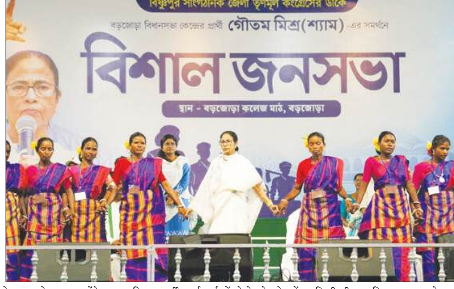
पेप लगाते हुए उन्होंने कहा कि महिला पहलवानों का क्या हुआ? उत्राव और हाथरस में क्या हुआ? 'मोदी-शाह प्रवासी पक्षियों की तरह'

झाड़ग्राम में एक अन्य रैली में बनर्जी ने चुनाव के दौरान काले धन के इस्तेमाल के प्रयासों का भी आरोप लगाया। उन्होंने कहा कि चुनाव के समय वे महिलाओं को 33 प्रतिशत आरक्षण देने की बात करते हैं, लेकिन अपनी पार्टी में महिलाओं का प्रतिनिधित्व क्या है? उन्होंने यह वादा पहले क्यों नहीं निभाया? उन्होंने दावा किया कि तुणमूल ने महिलाओं को 37 प्रतिशत से अधिक प्रतिनिधित्व दिया है और कई क्षेत्रों में यह 50 प्रतिशत तक है। भाजपा पर महिलाओं की सुरक्षा को लेकर गलत सूचना फैलाने का आर-