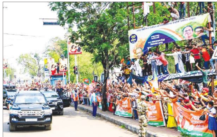
आसनसोल: नरेंद्र मोदी के रोड शो के दौरान उमड़ी भीड़, पश्चिम बंगाल विधानसभा चुनाव से पहले चुनाव प्रचार के दौरान लोगों का उत्साह।

5,700 किलोमीटर की दूरी तय कर कोलकाता पहुंचीं, जहां गुरुवार को एनसीसी कैडेटों व अधिकारियों ने उनका गर्मजोशी से स्वागत किया। 7,800 किमी में से अब तक वह लगभग 5,700 किलोमीटर की दूरी तय कर चुकी हैं, जबकि उनका अंतिम लक्ष्य चीन की सीमा से लगे अरुणाचल प्रदेश के सीमावर्ती क्षेत्र किशितु तक पहुंचना है। इस प्रेरणादायक अभियान का उद्देश्य महिला सशक्तीकरण, देशभक्ति और अटूट साहस का संदेश देना है। कोलकाता में एनसीसी के बंगाल व सिक्किम विभागों में गुरुवार को उनके सम्मान में आयोजित कार्यक्रम में एनसीसी कैडेटों को उनसे सीधे संवाद का अवसर मिला।