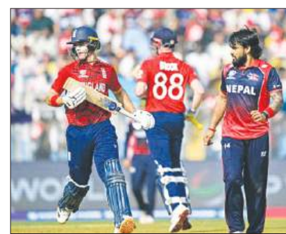
उल्टफेर से बाल-बाल बचा इंग्लैंड, नेपाल को चार रन से हराया पृष्ठ 8