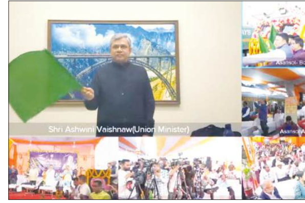
सुबह 7:00 बजे प्रस्थान कर बोकारो 11:15 बजे पहुंचेगी और वापसी में बोकारो से 15:40 बजे प्रस्थान कर आसनसोल 19:30 बजे पहुंचेगी। इस ट्रेन के प्रमुख स्टॉपेज में बर्नपुर, दमोदर,

सिउडी-कुमारपुर ओवरब्रिज और नई ट्रेन सेवा से बढ़ी सुविधा सिउडी में निर्मित नया रोड ओवर ब्रिज 42 करोड़ रुपये की लागत में बनाया गया है, जिससे लंबी प्रतीक्षा समाप्त होगी और यात्रियों के लिए तेज, सुरक्षित और सुगम यात्रा सुनिश्चित होगी। वहीं, कुमारपुर में निर्मित रोड ओवर ब्रिज 55 करोड़ रुपये की लागत में बना है और यह आसनसोल, पश्चिम वर्दवान और झारखंड के बीच महत्वपूर्ण कनेक्टिविटी को बेहतर बनाएगा। साथ ही, आसनसोल और बोकारो स्टील सिटी के बीच नई मेमू ट्रेन सेवा भी शुरू की गई। यह ट्रेन पश्चिम वर्दवान, पुरुलिया और झारखंड के बोकारो जिले से होकर जाएगी। प्रारंभिक रन आसनसोल से 17:00 बजे प्रस्थान कर बोकारो 21:45 बजे पहुंचेगा। निर्यात सेवा 10 फरवरी 2026 से शुरू होगी, जिसमें 8 कोच वाली ट्रेन समाह में छह दिन (रविवार को नहीं) चलेगी। आसनसोल से ट्रेन