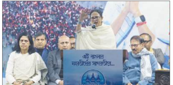
मुख्यमंत्री ममता बनर्जी ने गुरुवार की शाम कोलकाता के बाबूघाट के पास आउट्राम घाट में गंगासागर मेला के लिए लगाए गए वार्षिक सेवा शिविरों व सरकारी सुविधाओं का उद्घाटन किया। इस अवसर पर मुख्यमंत्री ने गंगासागर मेला में आने वाले पुण्यार्थियों से शांतिपूर्वक यात्रा करने

मुख्यमंत्री ने गंगासागर जाने वाले तीर्थयात्रियों से किसी भी अफवाहों पर ध्यान नहीं देने की अपील की ममता ने आउट्राम घाट में गंगासागर सेवा शिविरों का किया उद्घाटन कोलकाता, समाज्ञा : मुख्यमंत्री ममता बनर्जी ने गुरुवार की शाम कोलकाता के बाबूघाट के पास आउट्राम घाट में गंगासागर मेला के लिए लगाए गए वार्षिक सेवा शिविरों व सरकारी सुविधाओं का उद्घाटन किया। इस अवसर पर मुख्यमंत्री ने गंगासागर मेला में आने वाले पुण्यार्थियों से शांतिपूर्वक यात्रा करने