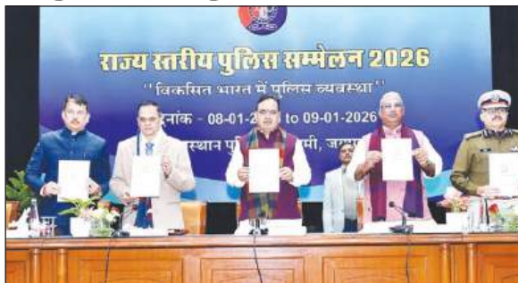
प्रतिशत की कमी आई है। आधिकारिक बयान के अनुसार मुख्यमंत्री ने कहा कि पुलिस प्रशिक्षण के नवाचारों ने राज्य को एक नयी पहचान दिलाई है। उन्होंने प्रसन्नता व्यक्त करते हुए कहा कि भारत सरकार के उपक्रम क्षमता विकास आयोग द्वारा राजस्थान पुलिस अकादमी को उत्कृष्ट संस्थान का दर्जा दिया गया है। यह अकादमी सभी राज्यों के पुलिस प्रशिक्षण संस्थानों में उत्कृष्ट संस्थान का दर्जा प्राप्त करने वाली प्रथम अकादमी बनी है। शर्मा ने पुलिसकर्मीयों को इस उपलब्धि के लिए बधाई देते हुए कहा कि इसी समर्पित भाव से राष्ट्र एवं समाज की सेवा करते हुए पुलिसिंग को मजबूत करें और नयी आपराधिक न्याय प्रणाली के क्रियान्वयन में प्रदेश को अग्रणी राज्य बनाएं। मुख्यमंत्री ने कहा कि नयी न्याय संहिता में त्वरित न्याय की अवधारणा से लोगों का विश्वास और प्रसन्न हो रहा है। इन तीनों पर कानूनों के क्रियान्वयन के तहत प्रदेश में चरणबद्ध रूप से सात वर्ष से अधिक सजा वाले मामलों में जांच एफएमएल के माध्यम से कराने के लिए थानों को सुदृढ़ किया जा रहा है।

जयपुर: राजस्थान के मुख्यमंत्री भजनलाल शर्मा ने बृहस्पतिवार को कहा कि पिछले दो साल में राज्य की कानून-व्यवस्था में उल्लेखनीय सुधार हुआ है और अपराधों की संख्या में कमी आई है। उन्होंने कहा कि विकसित भारत के संकल्प को पूरा करने में सुदृढ़ कानून-व्यवस्था की निर्णायक भूमिका है। शर्मा ने बृहस्पतिवार को राजस्थान पुलिस अकादमी में 'विकसित भारत में पुलिस व्यवस्था' विषय पर आयोजित एक राज्य स्तरीय पुलिस सम्मेलन में संबोधित करते हुए यह बात कही। मुख्यमंत्री ने कहा कि पिछले दो साल में राज्य की कानून-व्यवस्था में उल्लेखनीय सुधार हुआ है। उन्होंने कहा कि इस दौरान वर्ष 2023 के मुकामले अपराधों की संख्या में 15 प्रतिशत, हत्या के मामलों में 25 प्रतिशत, लूट के मामलों में 50 प्रतिशत की कमी आई है। वहीं, महिलाओं के खिलाफ होने वाले अपराधों में 10 प्रतिशत तथा अनुसूचित जाति एवं जनजाति के विरुद्ध अत्याचार के मामलों में 28