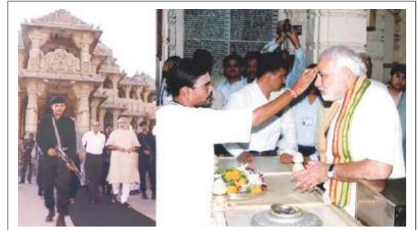
प्रधानमंत्री नरेंद्र मोदी ने सोशल मीडिया पर गुजरात में सोमनाथ मंदिर की अपनी यात्राओं की तस्वीरें शेयर कीं

नयी दिल्ली : प्रधानमंत्री नरेंद्र मोदी ने कहा है कि बृहस्पतिवार से शुरू होने वाला 'सोमनाथ स्वाभिमान पर्व' भारत माता के उन असंख्य सपूतों को स्मरण करने का पर्व है, जिन्होंने कभी अपने सिद्धांतों और मूल्यों से समझौता नहीं किया। मोदी ने 'एक्स' पर एक पोस्ट में कहा, "जय सोमनाथ! सोमनाथ स्वाभिमान पर्व की आज से शुरुआत हो रही है। एक हजार वर्ष पूर्व, जनवरी 1026 में सोमनाथ मंदिर ने अपने इतिहास का पहला आक्रमण झेला था। साल 1026 का आक्रमण और उसके बाद हुए अनेक हमले भी हमारी शाश्वत आस्था को डिंगा नहीं सके। बल्कि इनसे भारत की सांस्कृतिक एकता की भावना और सशक्त हुई और सोमनाथ का बार-बार पुनरोद्धार होता रहा।" प्रधानमंत्री 11 जनवरी को सोमनाथ स्वाभिमान पर्व में शामिल होंगे। इस मौके पर प्रधानमंत्री