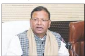
गए इस कैलेंडर में प्रमुख राष्ट्रीय, ऐतिहासिक और सांस्कृतिक तारीखों के साथ-साथ पार्टी के विचारकों, संस्थाओं और पीडीए - पिछड़ा (पिछड़ी जातियां), दलित और अल्पसंख्यक समुदायों से संबंधित सामाजिक हस्तियों की जयंती एवं पुण्यतिथि को भी दिखाया गया है। यह पंचांग सपा की राजनीतिक पंहुंच के

वाराणसी (उप्र): भारतीय जनता पार्टी (भाजपा) की उत्तर प्रदेश इकाई के अध्यक्ष पंकज चौधरी ने बृहस्पतिवार को समाजवादी पार्टी (सपा) के हाल में जारी 'पीडीए पंचांग' पर निशाना साधते हुए कहा कि विपक्षी पार्टी खुद ही इस बात को लेकर पक्का नहीं है कि पीडीए का मतलब क्या है, जबकि भाजपा समाज के सभी वर्गों को साथ लेकर चलने वाली समावेशी राजनीति में विश्वास करती है। हाल में समाजवादी पार्टी ने 2026 के लिए अपना 'समाजवादी पीडीए पंचांग' जारी किया है। पार्टी प्रमुख अखिलेश यादव द्वारा जारी किए