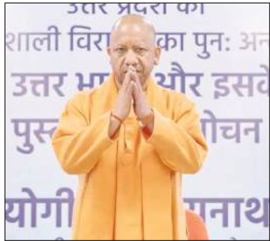
आयोजित किये जाएंगे। इसके अलावा सभी राजभवनों में संवाद स्थापित कर उन्में आयोजन सुनिश्चित किए जाएंगे। इन आयोजनों में प्रदेश सरकार के मंत्रांगण उत्तर प्रदेश के मूल निवासी प्रवासियों से संवाद करेंगे। मुख्यमंत्री ने दूसरे देशों में भारतीय दूतावासों के माध्यम से भी यूपी दिवस

लखनऊ: उत्तर प्रदेश की स्थापना की स्मृति में आयोजित होने वाला उत्तर प्रदेश दिवस (यूपी दिवस)-2026 इस वर्ष और अधिक व्यापक, भव्य एवं वैश्विक स्वरूप में मनाया जाएगा। आगामी 24 से 26 जनवरी तक राजधानी लखनऊ समेत प्रदेश के सभी जिला मुख्यालयों, देश के सभी राजभवनों और विभिन्न देशों में स्थित भारतीय दूतावासों में भी कार्यक्रम आयोजित किये जाएंगे। राज्य सरकार द्वारा बृहस्पतिवार को यहां जारी एक बयान के मुताबिक मुख्यमंत्री ने उत्तर प्रदेश दिवस-2026 की तैयारियों की समीक्षा करते हुए कहा कि उत्तर प्रदेश के नागरिक वर्तमान में देश-दुनिया के अनेक हिस्सों में अपनी पहचान बना चुके हैं। यूपी दिवस ऐसा अवसर बने, जो प्रवासी उत्तर प्रदेशवासियों को अपनी सांस्कृतिक जड़ों से जोड़े। उन्होंने निर्देश दिये कि आगामी 24 से 26 जनवरी तक प्रस्तावित तीन दिवसीय समारोह के तहत राजधानी लखनऊ में मुख्य आयोजन के साथ-साथ प्रदेश के सभी जनपद मुख्यालयों में कार्यक्रम