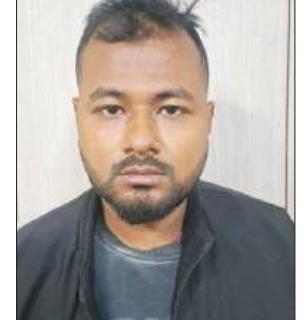
वॉलेट, लगभग 3,800 अमेरिकी डॉलर के बराबर क्रिप्टोकॉर्सी, क्रिप्टो वॉलेट व एक्सचेंज से संबंधित जानकारी तथा कई आपत्तिजनक चिट और दस्तावेज शामिल हैं। पुलिस का कहना है कि आरोपी डिजिटल अरेस्ट के नाम पर लोगों को डरकर उससे पैसे ऐंठने के जैक से जुड़े थे। मामले की आगे की जांच जारी है और इस गिरोह से जुड़े अन्य लोगों की तलाश की जा रही है।