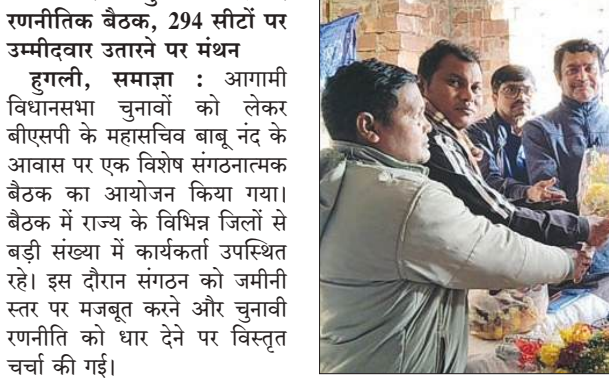
को गुमराह कर लड़े जा रहे हैं। उन्होंने आरोप लगाया कि हिंदू-मुस्लिम विवाद को जानबूझकर हवा दी जा रही है और तुष्टिकरण की राजनीति के लिए वोटों का धुवीकरण किया जा रहा है, जबकि बेरोजगारी, शिक्षा, बंद अस्पताल, बंद कारखाने, मानवाधिकारों पर अत्याचार और कानून-व्यवस्था जैसे