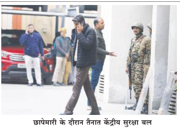
छापेमारी के दौरान तैनात केंद्रीय सुरक्षा बल

छापेमारी से भड़की ममता, कार्यालय से फाइल व लैपटॉप लेकर गई