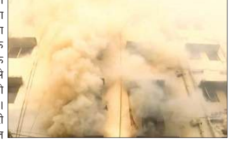
न्यूटाउन में बहुमंजिली इमारत में लगी आग, मती अफरा-तफरी

कोलकाता, समाज्ञा : कोलकाता के न्यूटाउन इलाके में गुरुवार की सुबह एक बहुमंजिली इमारत में आग लगने से अफरा-तफरी मच गई। जानकारी के अनुसार, सुबह करीब 7 बजे न्यूटाउन के थाकदारी इलाके स्थित एक बहुमंजिली इमारत में आग लगी। बताया गया है कि इमारत के भीतर स्थित एक कार्यालय में सबसे पहले आग की लपटें देखी गईं। घटना की जानकारी मिलते ही दमकल विभाग को सूचित किया गया। खबर पाकर दमकल की गाड़ियां मौके पर पहुंचीं और यूपेस्टर पर आग पर काबू पाने का प्रयास शुरू किया गया। इमारत में कई निजी कंपनियों के कार्यालय हैं, इसलिए कार्यालय समय शुरू होने से पहले ही आग को नियंत्रित करना दमकल कर्मियों के लिए बड़ी चुनौती बन गयी। प्राथमिक जानकारी के अनुसार, आग लगने की घटना में इमारत के भीतर किसी के फंसे होने की खबर नहीं है। दमकल विभाग की तत्परता से स्थिति को नियंत्रित करने की कोशिश जारी है, जिससे किसी बड़े हादसे को टाला जा सके। आग लगने के कारणों को लेकर दमकल विभाग ने शुरूआती तौर पर शॉर्ट सर्किट की आशंका जताई है। हालांकि, अधिकारियों का कहना है कि विस्तृत जांच के बाद ही आग लगने के सही कारणों का पता चल सकेगा।