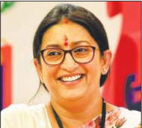
किया गया है, जहां उनका अपना घर है। क्षेत्र में उनकी राजनीतिक यात्रा के बारे में बताते हुए शुक्ला ने कहा कि ईरानी ने 2014 में अमेठी में सक्रिय राजनीति में कदम रखा और तब से लगातार इस क्षेत्र से जुड़ी हुई हैं। उन्होंने कहा, उन्होंने 2014 में राहुल गांधी के खिलाफ चुनाव लड़ा था लेकिन हार गई। इसके बावजूद, उन्होंने इस क्षेत्र को नहीं छोड़ा और 2019 में उन्हें हराकर अमेठी की सांसद बनीं।

अमेठी (उप्र): पूर्व केंद्रीय मंत्री और अमेठी की पूर्व सांसद स्मृति ईरानी का नाम मतदाता सूची के विशेष गहन पुनरीक्षण (एसआईआर) प्रक्रिया के तहत अमेठी की मतदाता सूची में शामिल कर लिया गया है, अधिकारियों और स्थानीय भाजपा नेताओं ने यह जानकारी दी। भारतीय जनता पार्टी अमेठी के जिला अध्यक्ष सुधांशु शुक्ला ने बताया कि स्मृति ईरानी ने 2024 के लोकसभा चुनाव में मेहनत मवाई गांव से मतदाता सूची में शामिल हुई थी और मतदान भी किया था। फिर अब एस आईआर में उनका नाम इस गांव से मतदाता सूची में शामिल है, जहां पर स्मृति ईरानी ने अपना आवास बनाया है। शुक्ला ने बताया, अब, एसआईआर प्रक्रिया के तहत, उनका नाम फिर से मेहनत मवाई गांव की मतदाता सूची में शामिल