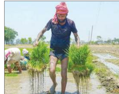
भारत बना दुनिया का सबसे बड़ा चावल उत्पादक, चीन को पछाड़ी: कृषि मंत्री पृष्ठ 6