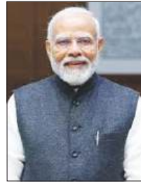
श्री नरेंद्र मोदी भारत के प्रधानमंत्री

श्रावण प्रस्तुतिकरण है। द्वादश ज्योतिर्लिंग स्तोत्रम में भारत के 12 ज्योतिर्लिंगों का उल्लेख है। ज्योतिर्लिंगों का वर्णन इस पंक्ति से शुरू होता है...सौराष्ट्र सोमनाथ च...यानि ज्योतिर्लिंगों में सबसे पहले सोमनाथ का उल्लेख आता है। ये इस पवित्र धाम की सभ्यतागत और आध्यात्मिक महत्ता का प्रतीक है। शाश्वत में ये भी कहा गया है: सोमलिङ्गं नरो द्रष्टुवा सर्वपापैः प्रमुच्यते। लभते फलं मनोवाञ्छितं मृतः स्वर्गं समाश्रयेत्॥