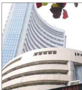
इकट्टी से 7,608 करोड़ रुपये निकाले। इससे पहले उन्होंने 2025

नयी दिल्ली : विदेशी पोर्टफोलियो निवेशकों (एफपीआई) ने 2026 की शुरुआत सतर्क रुख के साथ की है। पिछले साल के अपने बिकवाली के सिलसिले को जारी रखते हुए उन्होंने जनवरी के पहले दो कारोबारी सत्रों में भारतीय