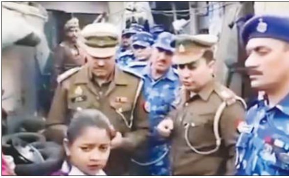
तृणमूल कांग्रेस द्वारा पोस्ट किए गए न्यूज चैनल के वीडियो का स्क्रीनशॉट

तृणमूल कांग्रेस के आधिकारिक सोशल मीडिया हैंडल से जारी बयान में दावा किया गया है कि उत्तर प्रदेश के गाजियाबाद में पुलिस ने बिहार