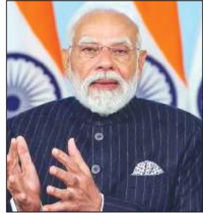
वाराणसी (उप्र): प्रधानमंत्री नरेंद्र मोदी ने रविवार को कहा कि पिछले साढ़े 11 वर्षों में सरकार ने देश में खेलों के क्षेत्र में व्यापक बदलाव करते हुए 20 से अधिक प्रमुख अंतरराष्ट्रीय टूर्नामेंट आयोजित किये हैं और भारत 'पूरी मजबूती से' 2036 के ओलंपिक की मेजबानी की भी तैयारी कर रहा है। वाराणसी में आज से शुरू हुई 72वीं सीनियर राष्ट्रीय वॉलीबॉल चैंपियनशिप के उद्घाटन कार्यक्रम से ऑनलाइन जुड़े प्रधानमंत्री ने कहा कि पिछले एक दशक में कई शहरों में फीफा अंडर-17 विश्व कप और हॉकी विश्व कप समेत 20 से अधिक प्रमुख अंतरराष्ट्रीय टूर्नामेंट आयोजित किए गए हैं। उन्होंने कहा, '2030 के