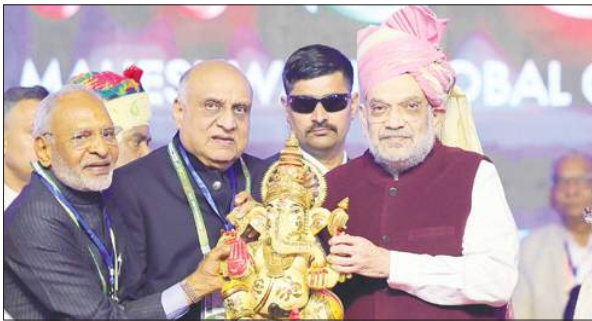
स्थानीय भाषाओं का ही इस्तेमाल करना चाहिए, क्योंकि इससे उनकी जड़ों से उनका जुड़ाव मजबूत होगा। मंत्री यहां आयोजित 'माहेधरी ग्लोबल कन्वेंशन' को संबोधित कर रहे थे, जहां माहेधरी समुदाय के सदस्य देश और विदेश के विभिन्न हिस्सों से एकत्र हुए हैं। शाह ने कहा, "यदि आप घर पर बच्चों से उनकी भाषा में बात करेंगे, तो वे अपने इतिहास से, अपने राज्य राजस्थान से स्वतः जुड़ जाएंगे... भाषा ही वह

जोधपुर : केंद्रीय गृह मंत्री अमित शाह ने शनिवार को 'आत्मनिर्भर भारत' के लक्ष्य को प्राप्त करने के लिए 'स्वदेशी' और 'स्वभाषा' को प्रोत्साहित करने की आवश्यकता पर जोर देते हुए लोगों से स्थानीय उत्पादों का निर्माण और उपयोग करने तथा घर पर केवल अपनी मातृभाषा में बातचीत करने का आग्रह किया। शाह ने कहा कि किसी भी समाज, संस्कृति और धर्म को संरक्षित रखने में भाषा महत्वपूर्ण भूमिका निभाती है। उन्होंने कहा कि हालांकि दुनिया में प्रगति के लिए आवश्यकतानुसार कोई भी भाषा सीखी या बोली जा सकती है, लेकिन घर पर बच्चों से बातचीत के लिए केवल हिंदी और