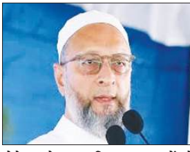
होने वाले नगर निकाय चुनावों से पहले महाराष्ट्र के सोलापुर में शुक्रवार को एक जनसभा को संबोधित करते हुए कहा, पाकिस्तान के संविधान के अनुसार, वहां केवल एक धर्म का व्यक्ति ही प्रधानमंत्री या राष्ट्रपति बन सकता है, लेकिन डॉ. बाबासाहेब अंबेडकर द्वारा लिखित भारतीय संविधान में यह स्पष्ट रूप से कहा गया है कि कोई भी नागरिक महापौर, राज्य का मुख्यमंत्री, या यहां तक कि देश का प्रधानमंत्री भी बन सकता है।

मुंबई : एआईएमआईएम प्रमुख असदुद्दीन ओवैसी ने कहा है कि एक दिन हिजाब पहनने वाली महिला भारत की प्रधानमंत्री बनेगी। उन्होंने कहा कि भारत का संविधान सभी सभ्यताओं के लोगों को समान दर्जा देता है जबकि पाकिस्तान का संविधान शीर्ष संवैधानिक पदों के लिए केवल एक ही समुदाय तक सीमित है। सत्तारूढ़ भाजपा (भारतीय जनता पार्टी) ने ओवैसी की इस टिप्पणी पर तीखी प्रतिक्रिया दी है। भाजपा ने कहा अपने 'गैरजिम्मेदाराना' बयान के माध्यम से हैदराबाद के सांसद 'आधा सर्व' पेश कर रहे हैं क्योंकि मुस्लिम महिलाएं हिजाब नहीं पहनना चाहतीं। ऑल इंडिया मजलिस-ए-इत्तेहादुल मुस्लिमीन (एआईएमआईएम) के प्रमुख असदुद्दीन ओवैसी ने 15 जनवरी को