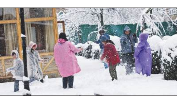
रहा, जहां पारा शून्य से नीचे 8.2 डिग्री सेल्सियस दर्ज किया गया। उत्तर कश्मीर के बारामूला जिले में स्थित प्रसिद्ध स्की रिसॉर्ट गुलनार्ग में न्यूनतम तापमान शून्य से नीचे 6.8 डिग्री सेल्सियस रहा।

श्रीनगर : जम्मू कश्मीर जबरदस्त सर्दी की चपेट में है और इस दौरान घाटी के तापमान में गिरावट दर्ज की गयी और शोपियां में तापमान शून्य से नीचे 8.2 डिग्री सेल्सियस दर्ज किया गया। इस बीच आसमान साफ रहा और डल झील समेत पानी के दूसरे स्रोत जम गये। एक अधिकारी ने यह जानकारी दी। अधिकारी ने बताया कि श्रीनगर में शुक्रवार रात न्यूनतम तापमान शून्य से नीचे 5.7 डिग्री सेल्सियस दर्ज किया गया। एक रात पहले यह शून्य से 6.0 डिग्री सेल्सियस से थोड़ा अधिक था। यह इस मौसम में शहर का अब तक का सबसे सर्द रात रही। शहर का न्यूनतम तापमान मौसमी औसत से 3.8 डिग्री सेल्सियस कम रहा। कड़ुके की ठंड के कारण डल झील के अंदरूनी हिस्सों समेत कई जलाशयों के कुछ हिस्से जम गये। दक्षिण कश्मीर में शोपियां घाटी का सबसे ठंडा इलाका