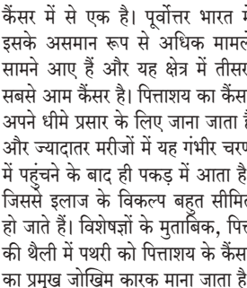
कैंसर में से एक है। पूर्वोत्तर भारत में इसके असमान रूप से अधिक मामले सामने आए हैं और यह क्षेत्र में तीसरा सबसे आम कैंसर है। पित्ताशय का कैंसर अपने धीमे प्रसार के लिए जाना जाता है और ज्यादातर मरीजों में यह गंभीर चरण में पहुंचने के बाद ही पकड़ में आता है, जिससे इलाज के विकल्प बहुत सीमित हो जाते हैं। विशेषज्ञों के मुताबिक, पित्त की थैली में पथरी को पित्ताशय के कैंसर का प्रमुख जोड़िकाकार माना जाता है, लेकिन इस समस्या के शिकार हर व्यक्ति में यह कैंसर नहीं पकड़ता और बड़ी संख्या में पित्ताशय के कैंसर के ऐसे मामले भी सामने आते हैं, जिनमें मरीज के पित्त की थैली में पथरी की शिकायत से जुड़ने का कोई इतिहास नहीं होता।

तेजपुर : असम के तेजपुर विश्वविद्यालय के शोधकर्ताओं ने खून में मौजूद ऐसे विशिष्ट रासायनिक संकेतकों (बायोमार्कर) की पहचान करने का दावा किया है, जिसे पित्ताशय के कैंसर के उपाय के बीच अंतर किया जा सकता है, जो पथरी और बिना पथरी दोनों के होते हैं। यह खोज पित्ताशय के कैंसर का समय रहते पता लगाने की उम्मीद जगाती है। विश्वविद्यालय की ओर से जारी बयान में कहा गया है कि शोधकर्ताओं ने रक्त-आधारित विशिष्ट 'मेटाबोलिक संकेतकों' की पहचान की है, जो पित्ताशय के कैंसर के निदान में मददगार 'बायोमार्कर' के रूप में काम कर सकते हैं। पित्ताशय का कैंसर सबसे घातक जठरांत्रिय (गैस्ट्रोइंटेस्ट्रिनल)