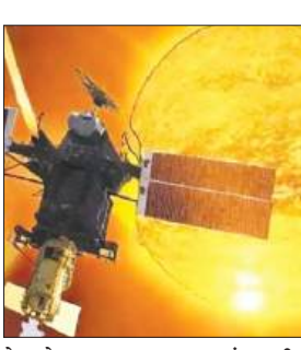
डेटा के साथ-साथ अन्य अंतरराष्ट्रीय अंतरिक्ष अभियानों के आंकड़ों का इस्तेमाल किया गया, ताकि सूर्य से निकले सौर प्लाज्मा के एक विशाल विस्फोट के पृथ्वी पर पड़े प्रभाव को समझा जा सके। बयान में कहा गया, "अंतरिक्ष मौसम (स्पेस वेदर) से तात्पर्य अंतरिक्ष में उत्पन्न उन

बेंगलुरु : भारतीय अंतरिक्ष अनुसंधान संगठन (इसरो) ने शनिवार को कहा कि उसके आदित्य-एल1 सौर मिशन ने नयी जानकारी प्रदान की है कि कैसे एक शक्तिशाली सौर तूफान पृथ्वी के चुंबकीय क्षेत्र को प्रभावित कर सकता है। इसरो ने एक बयान में कहा, "सबसे गंभीर प्रभाव सौर तूफान के अशांत क्षेत्र के प्रभाव के दौरान हुआ।" दिसंबर 2025 में 'एस्ट्रोफिजिकल जर्नल' में प्रकाशित एक महत्वपूर्ण अध्ययन में इसरो के वैज्ञानिकों और शोध छात्रों ने अक्टूबर 2024 में पृथ्वी को प्रभावित करने वाली अंतरिक्ष की एक बड़ी घटना का विस्तृत विश्लेषण किया। इस अध्ययन में भारत की पहली सौर वेधशाला आदित्य-एल1 से प्राप्त