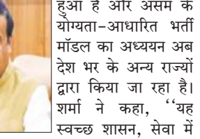
हुआ है और असम के योग्यता-आधारित भर्ती मॉडल का अध्ययन बन देश भर के अन्य राज्यों द्वारा किया जा रहा है। शर्मा ने कहा, "यह स्वच्छ शासन, सेवा में ईमानदारी और योग्यता आधारित भर्ती में पारदर्शिता के प्रति प्रतिबद्धता की पुनः पुष्टि है।" मुख्यमंत्री ने नियुक्ति पत्र प्राप्त करने वाले अभ्यर्थियों को बधाई देते हुए कहा कि पारदर्शी और योग्यता आधारित प्रणाली के माध्यम से उनकी नियुक्तियां एक विशिष्ट उपलब्धि रही हैं, जिसका अर्थ है कि निशोका और कर्मचारी दोनों ने सरकारी नौकरियों के लिए निष्पक्ष और पारदर्शी तरीकों का पालन किया है।

गुवाहाटी : असम के मुख्यमंत्री हिमंत विश्व शर्मा ने शनिवार को कहा कि राज्य सरकार ने पिछले पांच वर्षों में विभिन्न विभागों में 1.56 लाख युवाओं की भर्ती की है। उन्होंने वादा किया है कि शेष सभी भर्तियां 10 फरवरी तक पूरी कर ली जाएंगी, जिससे कुल संख्या 1.60 लाख हो जाएगी। उन्होंने असम प्रत्यक्ष भर्ती परीक्षा (एडीआरई) के तहत 6,347 ग्रेड-3 उम्मीदवारों को नियुक्ति पत्र वितरित करते हुए यह बात कही। मुख्यमंत्री ने कहा कि पूरी भर्ती प्रक्रिया पारदर्शी और मुकदमेबाजी से मुक्त रही है। उन्होंने कहा कि इन भर्तियों को लेकर उच्च न्यायालय में कोई मुकदमा दर्ज नहीं