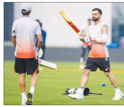
यूजीलैंड के खिलाफ वनडे श्रृंखला में भारत की निगाहें कोहली और रोहित पर पृष्ठ 8