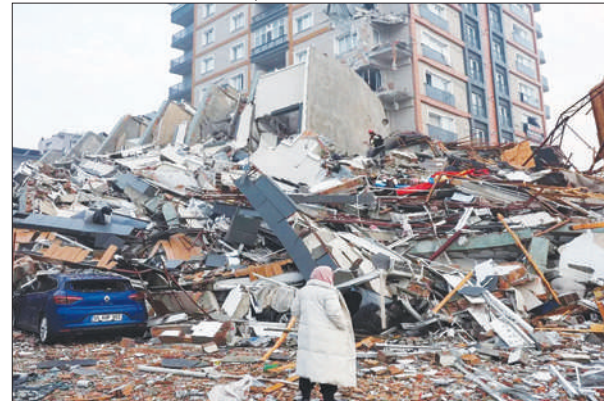
दशा में खिसकती हैं सागैंग फॉल्ट में चट्टानों के खिसकने की अनुमानित रफ्तार 11 मिलीमीटर से 18 मिलीमीटर सालाना है। चट्टानों के लगातार खिसकने से ऊर्जा का दबाव बनता है और यह समय-समय पर भूकंप के रूप में ऊर्जा बाहर निकलती है।

चुका है। भारत ने इस मुश्किल घड़ी में म्यांमार के प्रति संवेदना व्यक्त करते हुए हरसंभव मदद का आश्वासन दिया है। भूकंप से हजारों लोग घायल बताए जा रहे हैं, वहीं अनेक लोग अभी भी लापता बताए जा रहे हैं। अभी संख्या में इजाफा हो सकता है, क्यों कि मलबे के नीचे और अधिक लोग दबे हो सकते हैं। उधर, थाईलैंड की राजधानी बैंकॉक में एक 30 मंजिला इमारत गिर जाने से 10 लोगों की मौत हुई है। बैंकॉक शहर के अधिकारियों के अनुसार उन्हें अब तक 2,000 से ज्यादा इमारतों के नुकसान की रिपोर्ट मिली है। जियोलाॉजिस्ट्स (भूगर्भवेत्ताओं) के मुताबिक यह देश में 200 साल में आया सबसे बड़ा भूकंप है। भूकंप के झटके इतने शक्तिशाली थे कि केंद्र से सैकड़ों किमी दूर बैंकॉक के कई इमारतें नष्ट हो गईं। यहां तक कि भारत के मणिपुर तक भूकंप का असर हुआ है। जानकारी के अनुसार यहां के नोनी जिले में शनिवार को दोपहर 2:31 बजे 3.8 तीव्रता का भूकंप जमीन में 10 किलोमीटर की गहराई में था। हालांकि, भूकंप में किसी तरह के जानमाल का नुकसान नहीं हुआ।